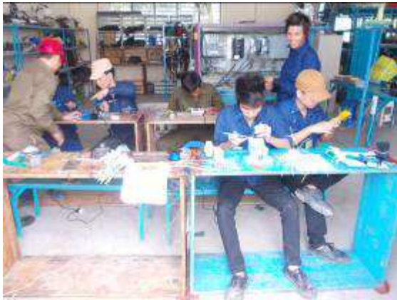
Photo 7: Schnell, wie die Tage vergehen, wenn so eine Arbeit da ist.