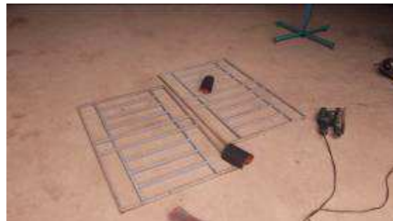
Photo 15: Wir informierten den Direktor. Er wollte sofort die Halle wieder neu malen lassen. Wir haben aber gesagt, „halt“. Warten, wir machen zuerst die Türen und Fenster. Denn diese sind nur grundiert und das Rostwasser verfärbt schnell die schöne, weisse Fassade. Hier die Gitter beim schleifen.