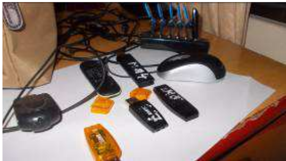
Photo 23: Jetzt haben wir Memory Stick's aus der Schweiz und Vietnam gekauft, damit alle Lehrlinge die CAD zeichnen, am Abend die Daten bringen, um diese prüfen zu können. Auch die Tagesleistung wird so kontrolliert.