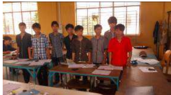
Photo 27: Erst 8 sind hier. Es kommen aber jeden Tag etwa 2 mehr. Aus ganz Vietnam werden sie geholt. Sie schlafen ja im Studentenhotel bei uns in der Schule.