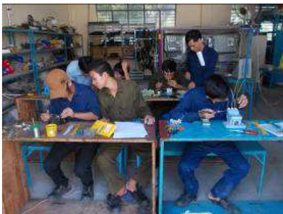
Photo 8: Rasch ist auch erkennbar, wer Durchhaltevermögen hat.