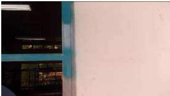
Photo 17: Ohne Abdecken der im März neu gemalten Wand, direkt daneben, haben sie begonnen blau, zu spritzen.