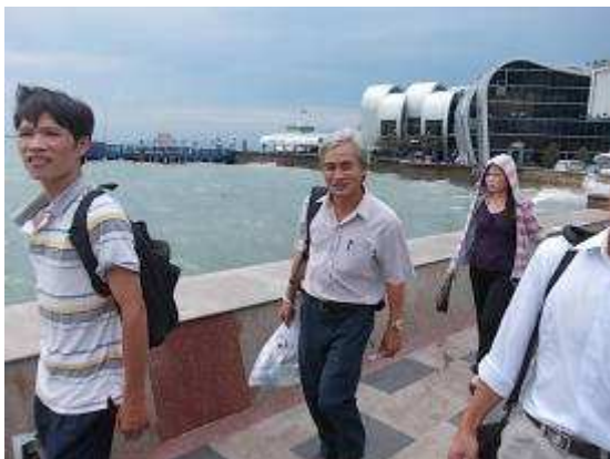
Photo 35: In Vung Tau war starker Wind. Das Boot fuhr ca. 1,5 Stunden ab Saigon. Hier sind wir unterwegs in's nahegelegene Hotel.

Ein weiterer Kommunikationstraining Trip ist geplant nach Dal Lat.