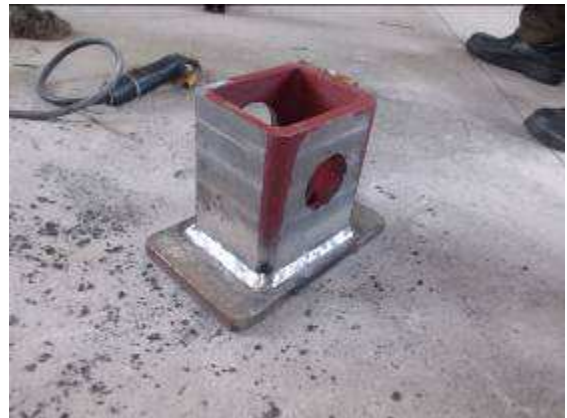
Photo 21: Diese Gehäuse des Wiap LC 50 haben wir nachfräsen lassen. Die Qualität des Gusses war gar nicht gut und wir wollten nicht spachteln, wenn der Vibrator hunderte von Stunden im Einsatz ist.