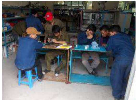
Photo 3: Für Angola haben wir die Herstellung von 5 x 180 Kabel bekommen. Da waren wir froh, dass die Lehrlingen elektrisch etwas zu tun haben. Auch Serienarbeit kann so geübt werden.