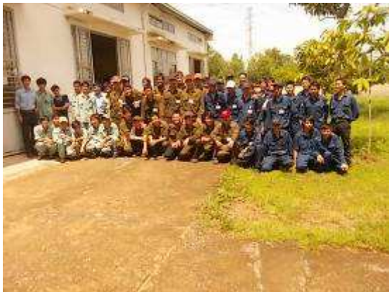
Photo 0: Ueber 50 Lehrlinge Blau 3. Lehrjahr. Braun 2. Lehrjahr Grüne 1. Lehrjahr. Es kommen aber noch 5 grüne die reisen noch von ganz Vietnam an.