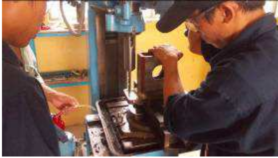
Photo 22: Auch gleich die Löcher bohren. Die Lehrlinge benötigen heute praktisch keine Händchenhalter mehr. Sie machen fast alles sehr selbständig.