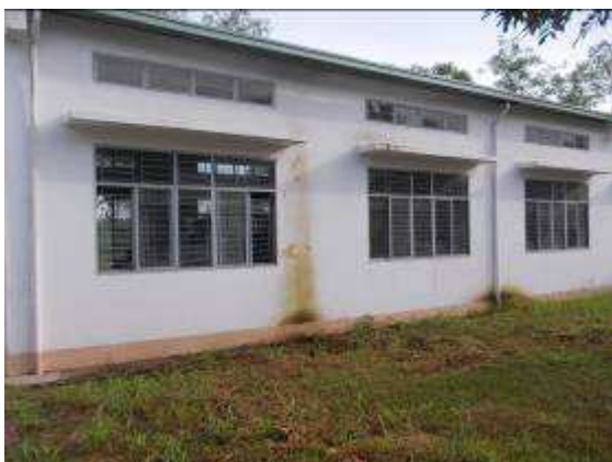
Photo 14: Unsere, im März 2012, neu gemalte Halle sieht nach wenigen Monaten wieder nicht mehr schön aus.