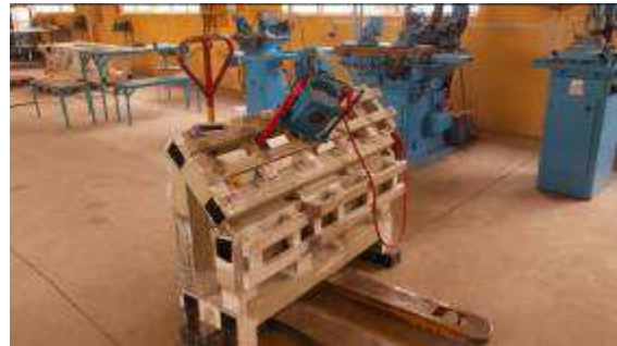
Photo 20: Das Bett wird noch einmal vibriert mit der Entspannungsanlage Wiap LC 20