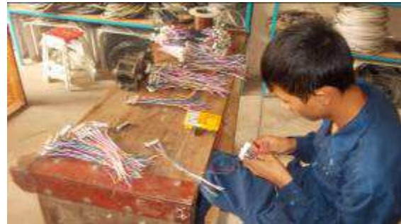
Photo 10: Interessant, ein Lehrling, welcher immer mit Abwesenheit glänzte und im Blechlager auch schon schlief, hat doch hier an der Arbeit den Narren gegessen. Wie ein Roboter hatte er das beste Durchhaltevermögen. Wir sind begeistert von seinem Einsatzwillen. Also lohnte es sich, ihn nach dem dritten Verwarnungsbrief, doch nicht zu entlassen.