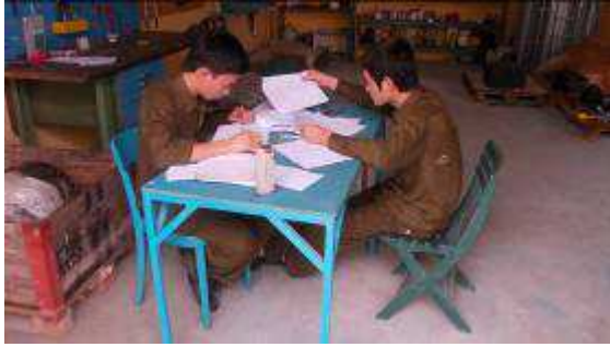
Photo 28: Diese beiden Lehrlinge zeichnen Schraubzwingen in 3 Ansichten. Wirklich schon gute brauchbare Zeichnungen machen die von Hand. Danach gingen sie zum CAD zeichnen, weil Bleistift fast nicht kopierbar ist.