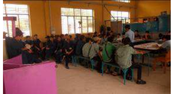
Photo 31: Wir haben den Lehrern schon vor Monaten gesagt, bitte neue Bänke und Tische machen für die neuen Lehrlinge. Doch in Vietnam soll gerne immer alles schnell gemacht werden. Und zwar erst dann, wenn es gebraucht wird!