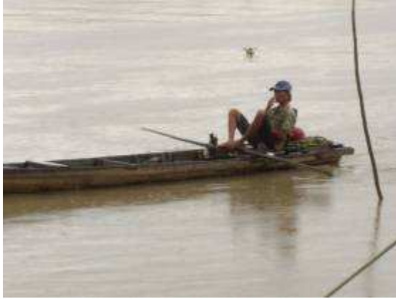
Photo 12: Am Ufer des Saigonrivers sehen wir diesen Fussruderer. Sieht speziell aus.