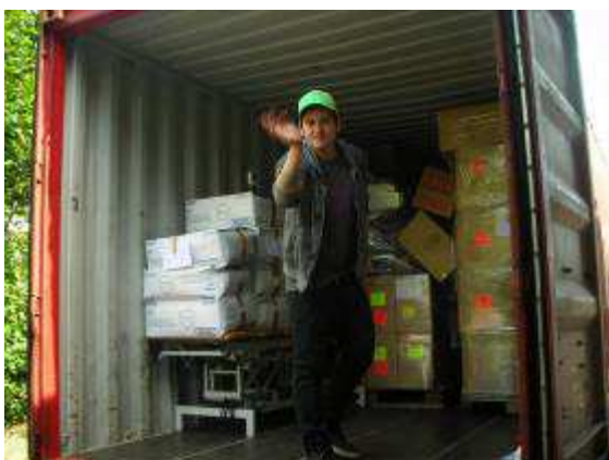
Photo 1: Noch vor der Abreise haben wir in Safenwil einen 40" Container geladen mit diversen Hilfsgütern. U.a. über 600000 Gesichtsmasken