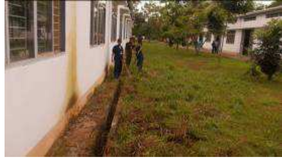
Photo14a. Schon im November 2010 haben wir einen Reinigungsplan gemacht für die Umgebung und die Hallen. Wir sagten es den Lehrern mehrmals. Es klappte nie. Jetzt haben wir es mit den Supportern begonnen, sie machen es recht gut.