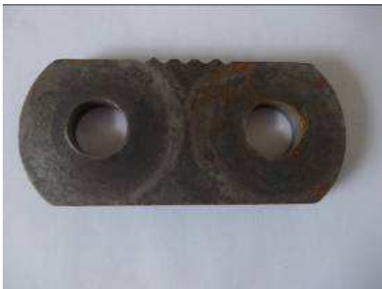
Photo 13: In Angola benötigen wir 200 solche Kettenglieder. Die Zähne oben sind stumpf. Seit 2 Wochen suchen wir nun das Material. D.h hier Maschinen zu bauen, kann schwierig werden, wenn für alles der Stahl aus dem Ausland importiert werden müsste. Wir suchen weiter.