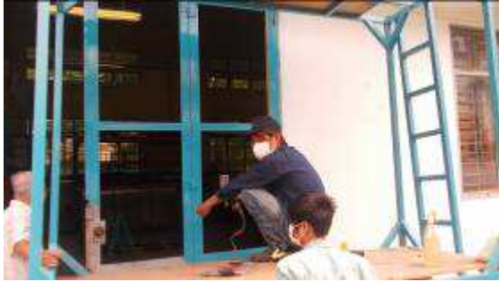
Photo 16: Plötzlich sehen wir einen Lehrling beim Spritzen der ersten Türe!