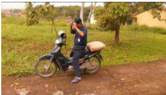
Photo 30: Wir benötigen Zement für unser Maschinenbett. Hätte ich gesagt, 5 Zement Säcke, er hätte auch 5 mit dem Mofa gebracht. Unglaublich, was sie alles auf Mofa legen.

Und darum ist ab und zu auch einiges Pfusch. Daran arbeiten wir, dass das Vorausdenken besser wird.