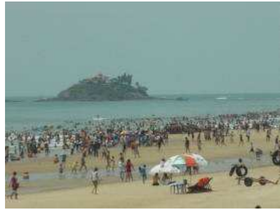
Photo 36: So viele Leute sahen wir noch nie hier wie an diesem Sonntagmorgen. Am Mittag regnet es dann wie aus Kübeln und es kam ein Sturm. Dieser war so schlimm, dass wir mit dem Taxi zurück fahren mussten, nicht mehr mit dem Schiff.