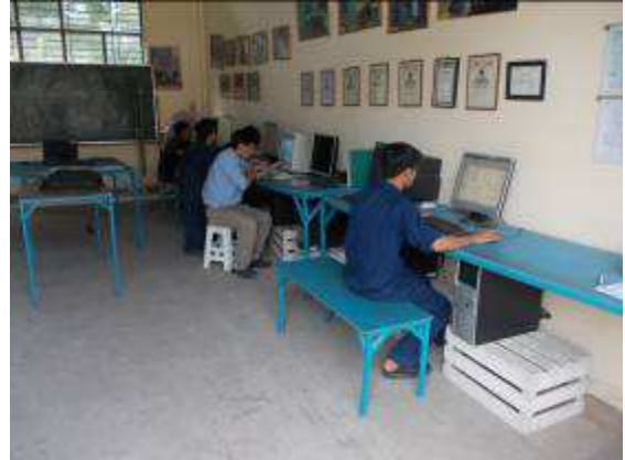
Photo 25: In der Zeichnungsabteilung haben wir noch 3 PC reparieren lassen, damit wir 8 Stk. haben. Wir müssen noch mehr Plätze organisieren. 3 Lap Top haben wir nur noch.