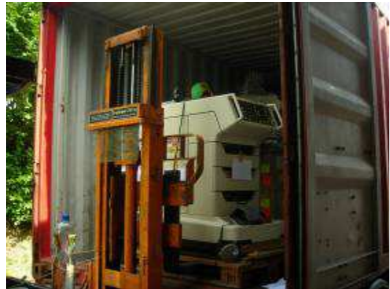
Photo 2: Auch ein Lasergerät und ein Ultraschall aus einer aufgelösten Arztpraxis haben wir dabei.