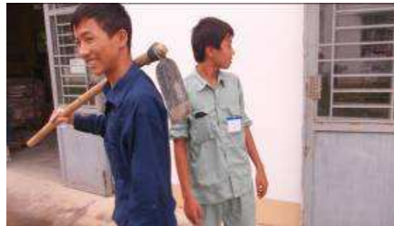
Photo14b. Lehrling A3 lacht noch, dass er Arbeiten gehen darf.