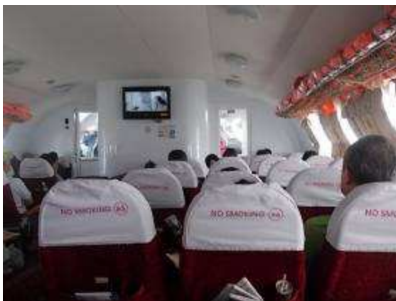
Photo 34: So sieht ein Schiff von innen aus wie ein Flugzeug. Es sind alte russische Schnellboote.