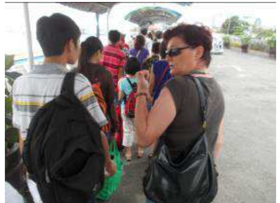
Photo 32: Zu Beginn der Schulung bei diesem Trip haben wir der Schulleitung und den Lehrern gesagt, dass NR 1 jetzt eine gute Kommunikation ist. D.h. wir müssen Kommunikations-Training machen. Darum haben wir die Lehrer nach Vung Tau mit dem Schiff eingeladen. Weekend KW 35/36, 2012