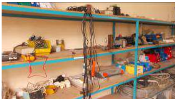
Photo 10b: Der LötKolben Verschleiss war enorm. Wir gingen 3 x 4 Stk. LötKolben holen. 25 Watt und 30 Watt. Der Preis ist ok. 80000 Dong = 4 Franken. Doch einige liefen nur ca. 2 Stunden dann waren sie defekt. Made in China! Also, ist nicht immer alles billige auch gut! Leider haben wir unsere 2 teuren Lötstationen Weller die wir mitnahmen, nicht gefunden.