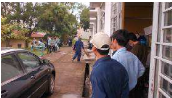
Photo 29: Hinten die ersten C Lehrlinge zu erkennen, sie haben hellgrüne Ueberkleider.

Und darum ist ab und zu auch einiges Pfusch. Daran arbeiten wir, dass das Vorausdenken besser wird.