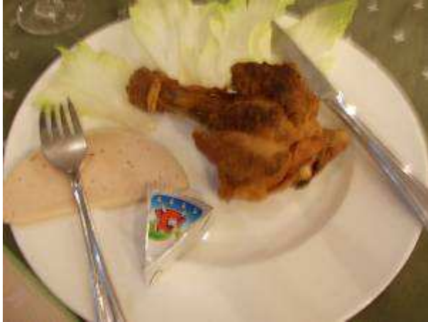
Photo 38: Am Samstag den 8.9.2012 haben wir in unserem Stammlokal (Uebername= Apotheke), das erste Mal ein Cordon bleu bestellt. Es war lustig, wo der Käse und der Schinken (eher Lioner) war. Aber es stand wohl so auf der Speisekarte. Cordon bleu = Huhn mit Käse und Schinken.

Ende Photobericht 23. Erster in diesem Trip August Sept 2012. hpw