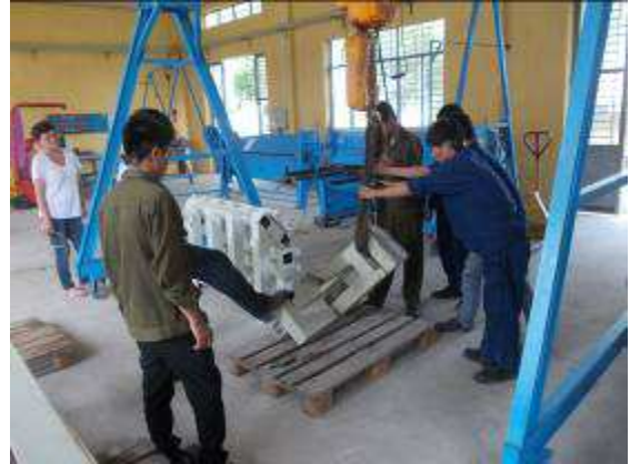
Photo 19: In der Schlosserei geht es weiter mit dem Herstellen der kleinen Schrägbett Drehmaschine Wiap DM2_W. Wir machen die Änderung, damit das Bett gefräst oder gehobelt werden kann.