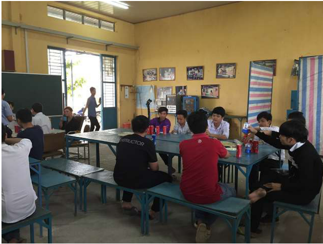
Thứ vị. Chúng tôi đã mua theo yêu cầu của cậu bé 1 hộp bia, 1 Hộp Cola và 1 hộp nước uống tăng lực. Sự thôi thúc rượu là thêm về giảm béo mà không phải là xấu. Không gian 3a. ảnh WS10_660