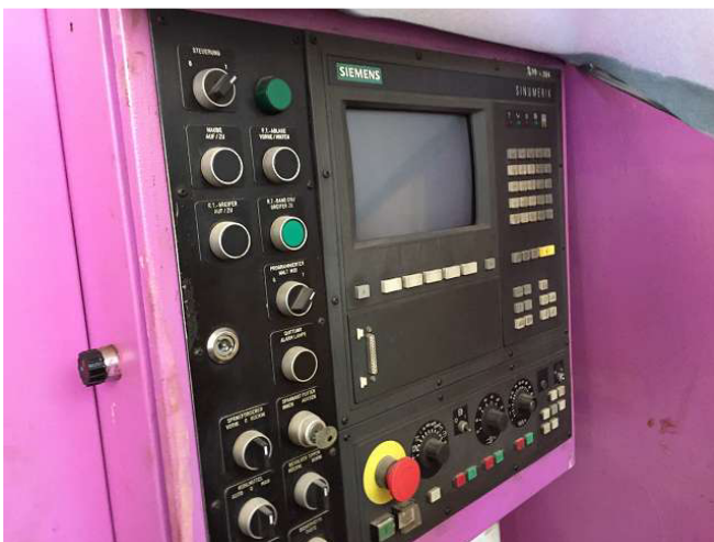
Một trong những đáng tin cậy nhất CNC SINUMERIK 810T GA2 tại máy WIAP DM2 V. Nếu máy này đang chạy, người học nghề tiện CNC. Và điều đặc biệt về

nó: nó hoạt động hoàn toàn tự động, họ có thể có và xem bàn tay trong túi của bạn. Phòng 5. Ảnh WS10_630