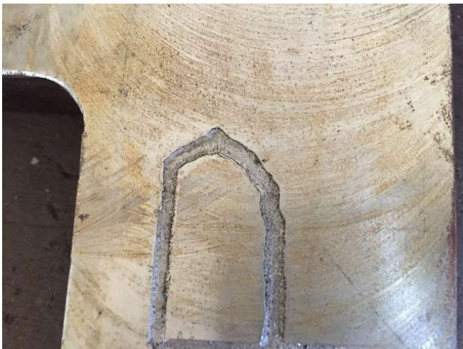
Việc chăm sóc trong quá trình xay xát là rất quan trọng. Điều gì là không thể được tái hàn lại và tái tạo. Điều này là tốt hơn để được như thế. Đó là một sự xấu hổ, vì vậy ném một phó. Nhưng nó phải được bỏ đi trước khi họ nhìn thấy thứ ba, nếu điều này là không cố định! Phòng 2 Ảnh WS10_120.