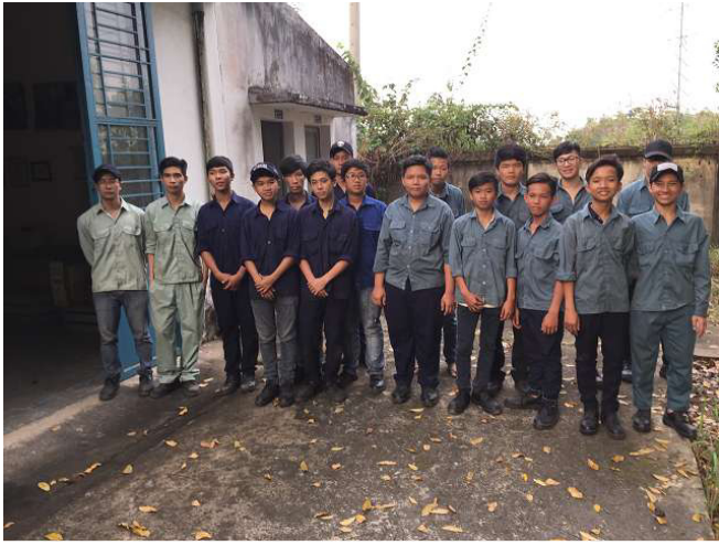
Ở phía bên trái, hai trưởng các giảng WIAP (ánh sáng xanh) trong màu xanh Trong trang phục, nhóm E, giáo viên hướng dẫn đào tạo. váy xanh Qua Phải, học nghề mới G nhóm. ảnh WS10_20