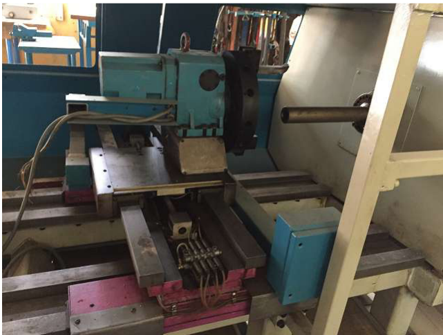
Nó không nhìn tốt đẹp từ các máy WIAP DM2S. Đó là tất cả rỉ sét và dơ bẩn. Phòng 5. Ảnh WS10_584