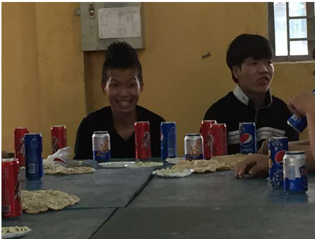
Gần một chút nghịch ngợm, giống như các chàng trai như thế nào, nhưng bạn cười, đó là điều chính. Trong số 54 học việc cuối cùng phải từ tất cả các nhóm có thể mất một số điểm ở Nhật Bản. Đó cũng là những gì họ đã học được từ chúng tôi, người Nhật thực sự có thể sử dụng! Không gian 3a. ảnh WS10_680