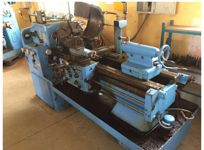
Bây giờ nhìn thấy các máy tiện Thụy Sĩ từ bang Aargau menziken, tốt hơn rất nhiều. Sau lễ hội Tết khay thậm chí làm mát được làm sạch xuống sạch sẽ và bôi dầu, thức ăn có thể được. Phòng 2 Ảnh WS10_470