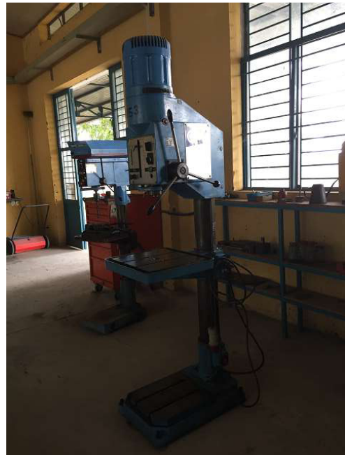
Và đây khoan thứ ba trong chế độ đào tạo. Phòng 2 Ảnh WS10_550