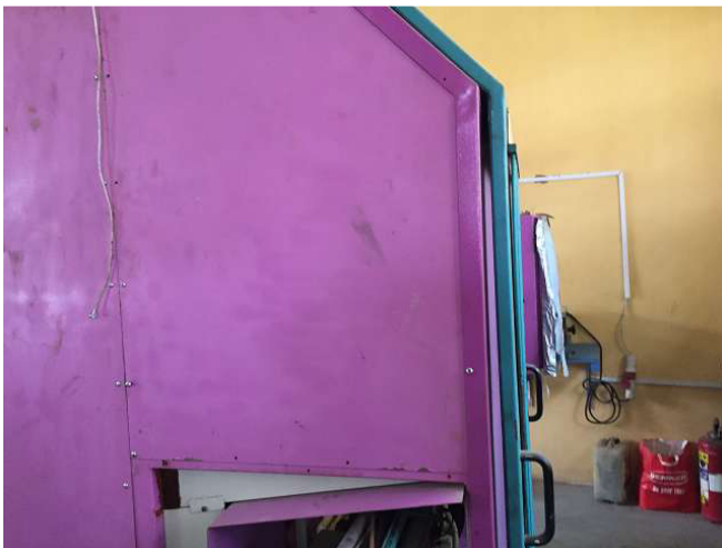
Máy WIAP DM2V làm để kết thúc. Các tấm phun được phun sơn, đó là không tốt. Bạn phải đánh bóng và phun. Phòng 5. Ảnh WS10_620