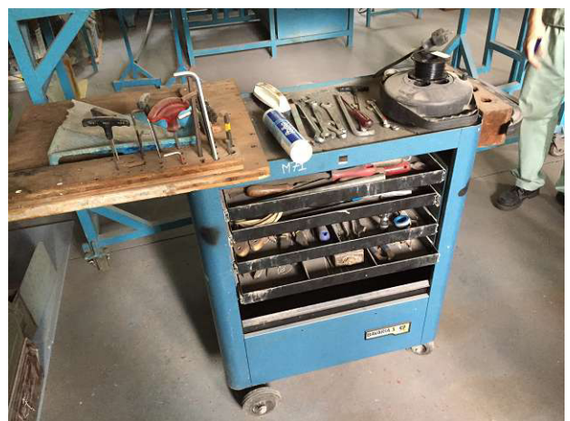
Công cụ này xe đẩy, chúng tôi mang đến từ Thụy Sĩ. Ông đã đưa ra rất tốt đẹp. Nhưng nó có vẻ bây giờ không nhìn tốt. Điều này cần phải được cải thiện. Không gian 4b. ảnh WS10_150