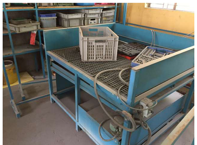
Khả năng làm sạch cho các bộ phận nặng lên đến 1500 kg. Lộn xộn và dơ bẩn. Không gian 4b. ảnh WS10_100