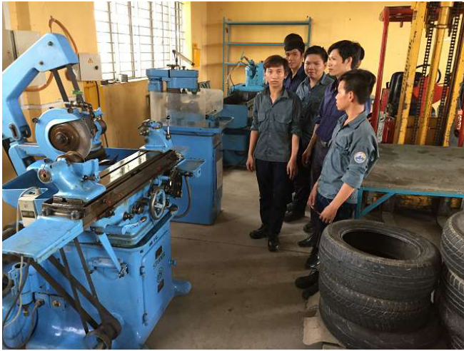
máy mài tròn Studer NGUR này, chúng tôi đã mua Sulzer zuchwil. Sau đó, khi bảo dưỡng được tổ chức để có thể được nghiền trong 0.001 mm. Không gian 1b. ảnh WS10_560

máy mài nổi này được xây dựng để nghiền thanh cắt. Chúng tôi đã mua nó ở Thụy Sĩ. Bảng bên trong có thể được luân chuyển đến bất kỳ vị trí độ. Những hướng dẫn bây giờ sẽ nghiền nó, để họ có thể để cho các chàng trai làm điều đó là tốt. Không gian 1b. ảnh WS10_560