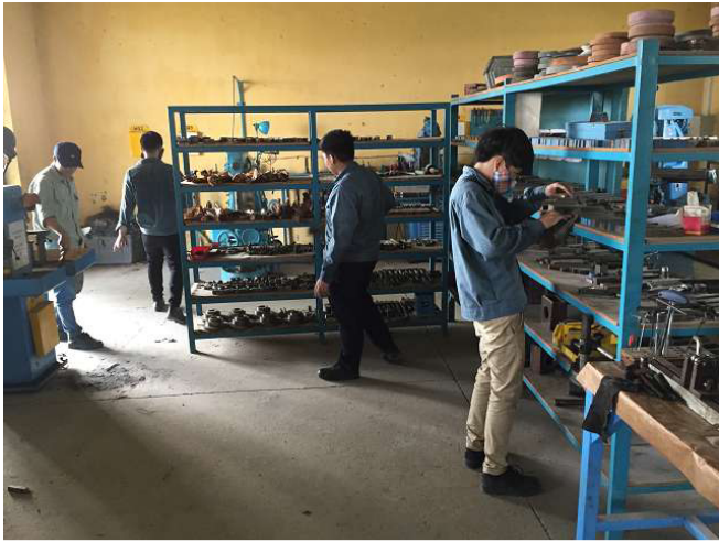
Mỗi giảng viên trong việc đào tạo ghi được 2 người học nghề và được phân bổ một không gian để làm sạch tốt đẹp. Phòng 2 Ảnh WS10_430