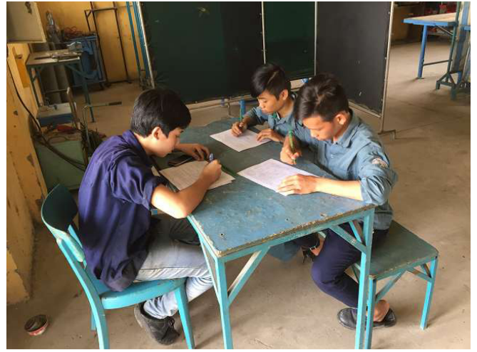
Kể từ khi nhà trường có 9 phòng; tức là 6 phần của hội trường, bao gồm 3 hai mảnh, chúng tôi có 9 khoang Hội thảo. Vì vậy khi kiểm tra độc quyền, hoạt động yên tĩnh là có thể, chúng tôi có một bảng được cung cấp với băng ghế tự sản xuất ghế trong tất cả các phòng mỗi. Cậu bé này đang ngồi trong phòng 1 trong các cửa hàng hàn. ảnh WS10_40