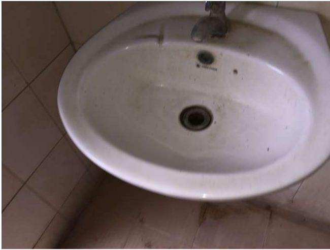
Tại sao không bao giờ được làm sạch? Đến từ: WC phía sau không gian 6. Ảnh WS10_290