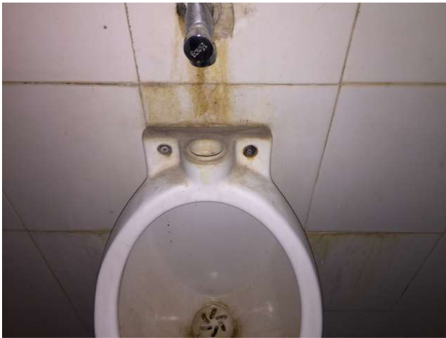
Tại sao lại có sự kết nối bị lỗi? ảnh WS10_300