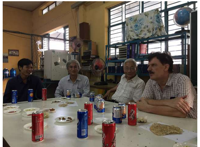
Ngay cả trước khi lễ kỷ niệm cuối cùng chúng ta đã thảo luận với giám đốc các chương trình trao đổi Bang WIAP. Chúng tôi sẽ cố gắng tổ chức không chỉ giảng dạy Việt Nam, mà còn ở những nơi khác, vì vậy chúng tôi có thể thay thế các giáo viên hướng dẫn. Động cơ sẽ là một động cơ, do đó kỷ luật, sạch sẽ và học tập tốt như công việc, quan tâm nhiều hơn ý. Giám đốc Bang là 2 đôi độc đáo herrichten ở trường. Chúng tôi là lúc tốt nhất hỗ trợ một ít mà nó là thực sự tốt đẹp cũng có. Với máy cà phê, lò vi sóng, ấm nóng, TV, máy lạnh, tủ lạnh, vòi hoa sen đẹp và vệ sinh tốt đẹp. Vì vậy, các giáo viên hướng dẫn các ông chủ bên ngoài để đặt ở Việt Nam giống như tình yêu. Không gian 3a. ảnh WS10_700