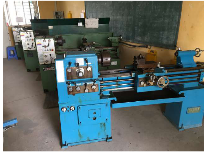
Sau Tết, làm sạch một lần nữa được cải thiện. Các màu xanh nên xanh sạch. Các bể nước ở trên giường cũng phải sạch. Phòng 2 Ảnh WS10_460