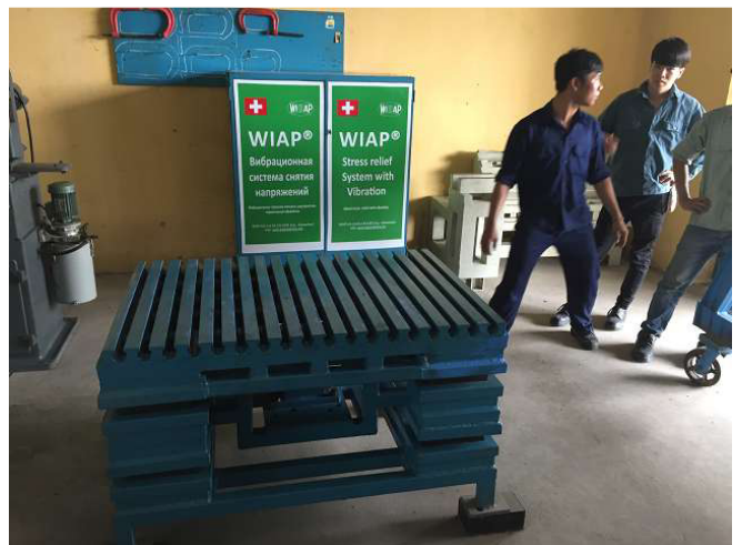
Hàn bảng shaker, 2 như chúng tôi được xây dựng tại Việt Nam. Thật không may, các mối hàn không tốt đẹp mà chúng ta là hai không bao giờ nehmen đến châu Âu. Chúng tôi sẽ để lại cùng một bảng ở châu Âu thậm chí còn tính toán và vẫn tập luyện một chút hàn tại Việt Nam. Đẹp hàn! Kể từ khi chúng tôi vẫn còn có một nhiệm vụ phía trước của chúng tôi. Không gian 1b. ảnh WS10_570