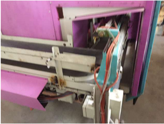
Máy WIAP DM2V làm để kết thúc. Brown không rỉ sét, chỉ chống gỉ. Phòng 5. Ảnh WS10_610