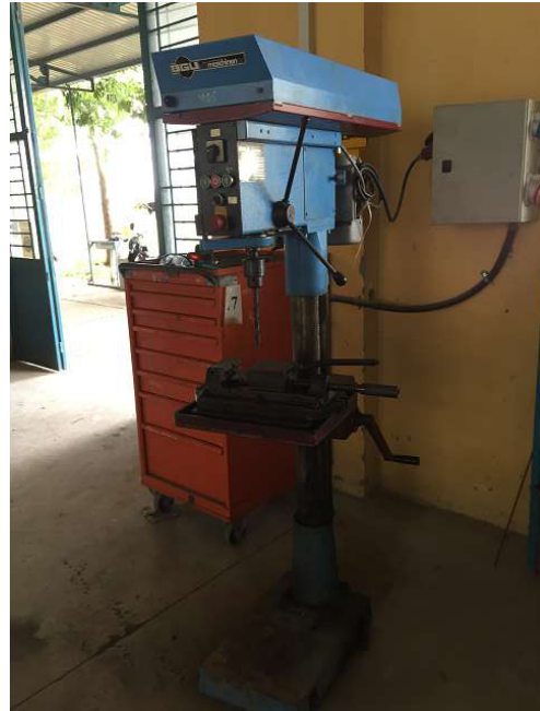
khoan nhỏ được availed hầu như hàng ngày. Phòng 2 Ảnh WS10_540