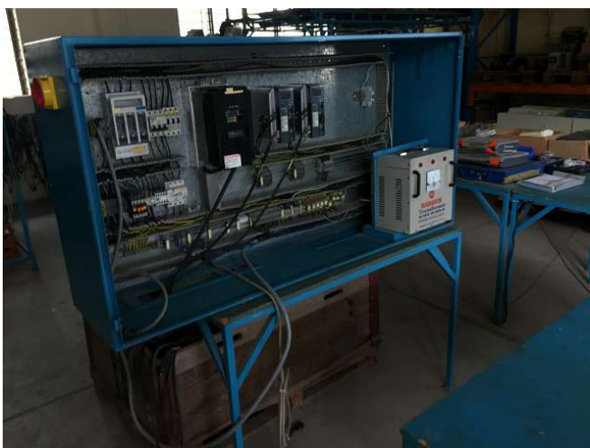
Đây là tủ điện của WIAP DM2S. Motors, mọi thứ đều ở đây. Nhưng ở đây chúng tôi đang trong giai đoạn thử nghiệm, nếu không chúng ta nên làm tất cả mọi thứ cho các sản phẩm mới nhất của Siemens, để các giảng viên có thể tìm hiểu nghệ thuật của thế hệ tiếp theo. Phòng 5. Ảnh WS10_585