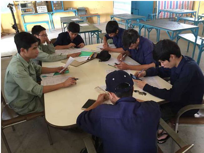
Vào buổi sáng giảng dạy trưởng (trái màu xanh lá cây nhạt) các giảng viên trong các thử nghiệm đào tạo XY01 để XY11 để họ có thể tập luyện vào buổi trưa. ảnh WS10_30