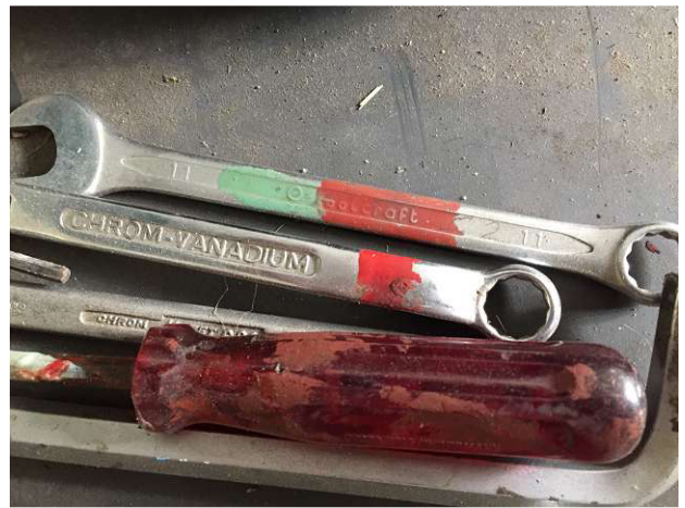
đã được biết đến mà không 5S Sytem, chúng tôi đã đánh dấu tất cả các trạm công cụ với màu sắc trong giảng dạy trong năm 2010. Chúng tôi dạy để trẻ em trai, như đã biết các công ty đào tạo Thụy Sĩ cũ từ các năm trước. Phòng 2 Ảnh WS10_130.