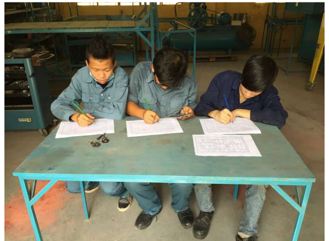
giảng viên trong đào tạo này, phải, và hai cậu con trai còn lại, ngồi trong sơn và hoàn thiện bề mặt phòng 4b phận. ảnh WS10_50