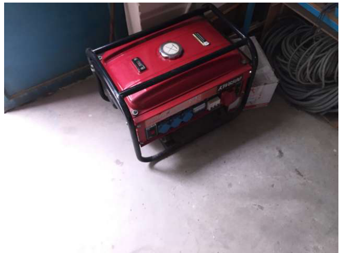
Điều này ít nhất là các hoạt động lý thuyết có thể được tiếp tục nếu trong Việt Nam điện bị tắt một số khu vực trong mùa khô, một máy phát điện là một điều tốt. Các máy phát điện 400 Volt được mang đến từ Thụy Sĩ và cũng có thể được sử dụng để khoan. Không gian 1b. ảnh WS10_590