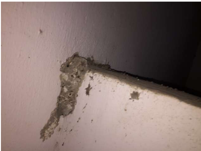
Tại sao tổ ong đều không bị xóa? Đến từ: WC phía sau không gian 6. Ảnh WS10_310

Toàn bộ mặt tiền của trường đã được sơn lại khoảng 3 năm trước đây. Các chi phí, chúng tôi đã giảm đi một nửa các trường học. Tại sao thấy trong bệnh viện Việt Nam trong thời gian ngắn lại như thế? Đó có phải là chất lượng công việc? Hoặc những tài liệu? Đến từ: Ngoại thất không gian 3b. ảnh WS10_330