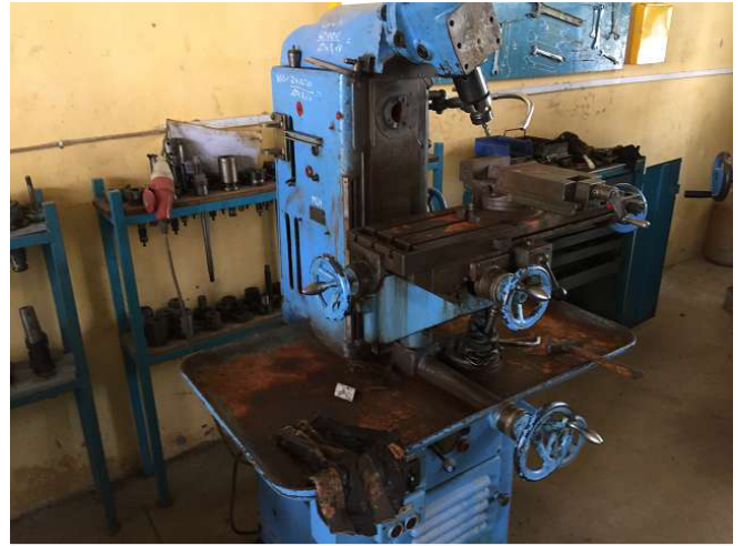
Đây Thụy Sĩ phay Schaffner tất cả mọi thứ đã gỉ trên máy. Nếu không có nước làm mát, Emulsison, làm việc không tốt, sau đó rỉ ngay lập tức. Và hãy để quá lâu để hành động thức ăn cho rỉ vào thép, để lại vết lõm. Phòng 2 Ảnh WS10_80