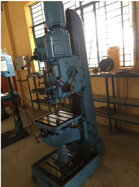
Nếu không tốt khó có thể đi sâu được làm việc. Máy này đã được tại Thụy Sĩ CHF 800 .- - và có thể ảnh hưởng mạnh mẽ như máy Reibo Thụy Sĩ, một bài thuyết trình tốt đẹp của Thụy Sĩ. nhưng đến với nhau Mà chi phí, mang lại ở Thụy Sĩ cho đến khi cô ấy đang ở Việt Nam, cũng với thủ tục hải quan và thuế GTGT, đó là cũng được ghi nhận. Phòng 2 Ảnh WS10_530