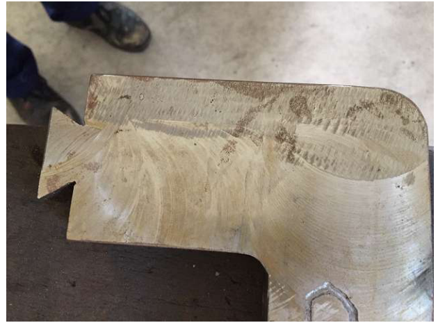
Những dấu vết của thức ăn quá nhanh sẽ không đi xa bằng mạ. Điều đó phải được hàn hoặc loại bỏ các kẹp. Phòng 2 Ảnh WS10_130