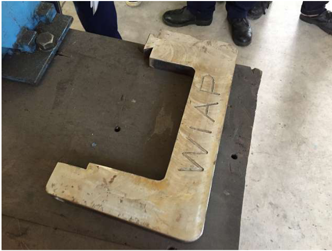
WIAP an toàn kẹp vào bằng sáng chế http://www.wiap.ch/Patent%20Schraubzwinge/Scraubzwinge_Patent_ch_hp01062016.pdf , Nằm dài tào pallet và bằng. Phòng 2 Ảnh 2 WS10_110.