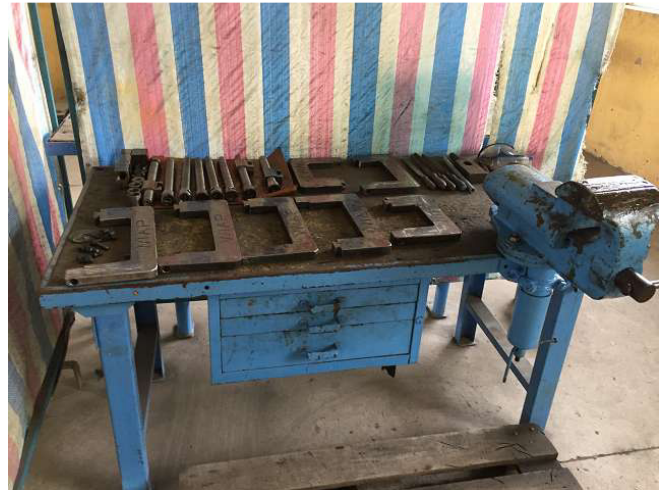
Bảng hàn đã được sắp xếp gọn gàng. Chúng tôi đã yêu cầu, tất cả mọi thứ luôn luôn xinh đẹp, ra lệnh nói dối. Không phải mọi thứ ném vào ngăn kéo, vì vậy có tồn tại một rối loạn tiềm ẩn. Nó được đặt trên bàn, đó là chưa kết thúc, nhưng độc đáo ra legen.Raum 1a. ảnh WS10_560

máy mài nổi này được xây dựng để nghiền thanh cắt. Chúng tôi đã mua nó ở Thụy Sĩ. Bảng bên trong có thể được luân chuyển đến bất kỳ vị trí độ. Những hướng dẫn bây giờ sẽ nghiền nó, để họ có thể để cho các chàng trai làm điều đó là tốt. Không gian 1b. ảnh WS10_560