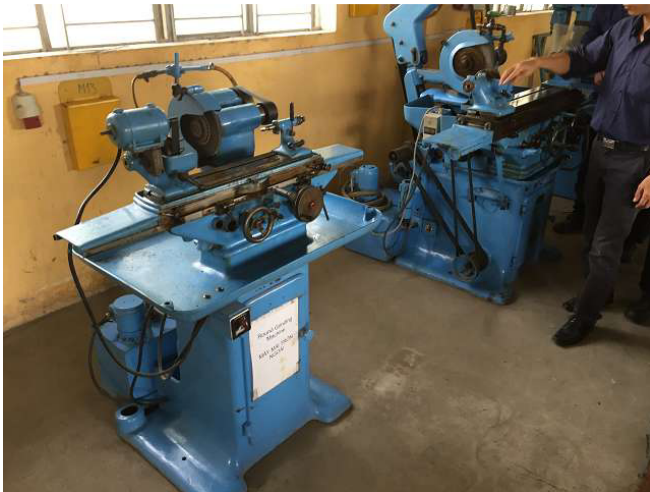
Cũng thứ hai, hơi nhỏ hơn, dễ quản lý hơn trụ máy xay này là lý tưởng cho mài trực cứng. Nó đã đồng ý với các hướng dẫn viên trưởng rằng điều này bây giờ được nối đất chắc chắn. Không gian 1b. ảnh WS10_580