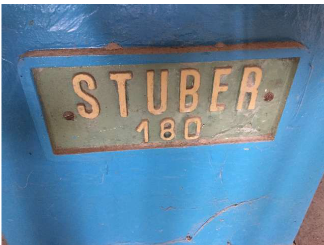
Tất cả các máy tiện thông thường của chúng tôi cũng có thể cắt sợi. Tất cả các ốc vít hình thang kẹp mà đã được sản xuất cho đến nay, đã được thực hiện trong giảng dạy. ảnh WS10_450