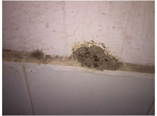
tổ ong trong nhà vệ sinh. Đến từ: WC phía sau không gian 6. Ảnh WS10_320