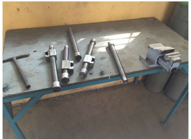
Nằm xung quanh cọc, bản và lộn xộn. Phòng 1. Photo WS10_90