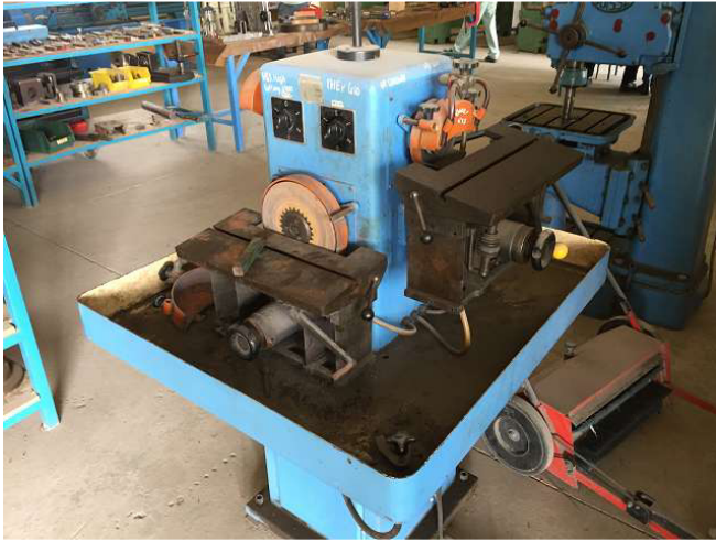
Một máy xay công cụ độc quyền cho bánh xe 4 mài cũng như bánh xe kim cương đã hoàn toàn bị ô nhiễm và unpurified trong phòng 2 chỉnh sửa. ảnh WS10_60