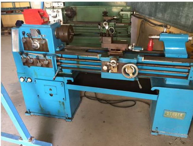
máy tiện Stuber này đã được với các WIAP chứa cuối cùng. Nó được sơn lại từ màu xanh sang màu xanh trường đại học của chúng tôi. Phòng 2 Ảnh WS10_440