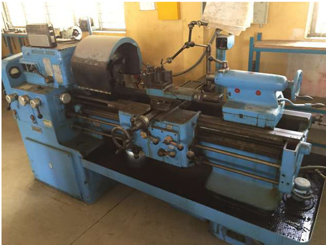
Điều này có giá trị, máy tiện Thụy Sĩ cũ menziken từ bang Aargau bản và không có dầu trên hướng dẫn. Chúng tôi gần như có được nước mắt khi xem trạng thái của máy. Phòng 2 Ảnh WS10_70