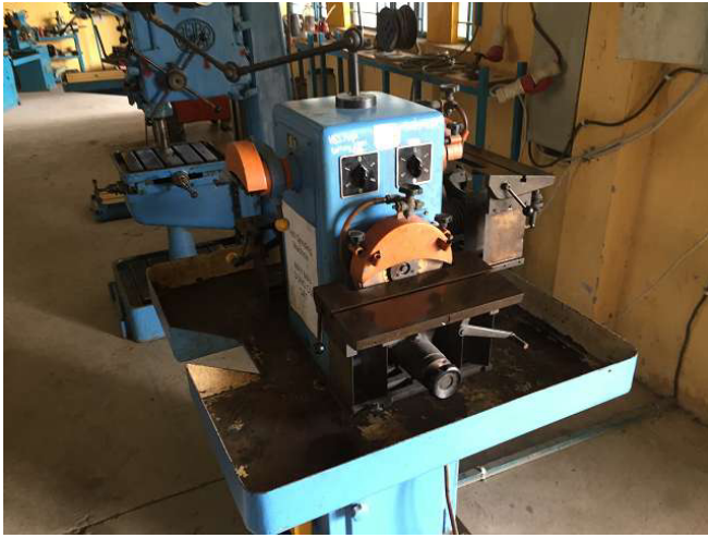
Máy xay độc quyền là lại đẹp. Tại sao không? ảnh WS10_520