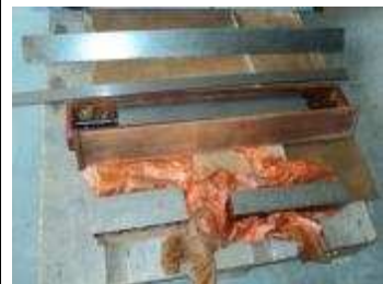
Diverse Touchierlineale auch für Schwalbenschwanz