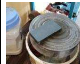
Danach den Stein gut waschen