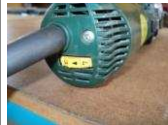
Hub Regulierung bis 1600 Hübe pro Minute