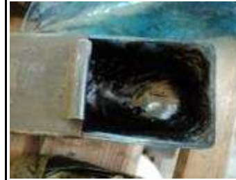
Offene Touchierfarbe in sauberer Dose