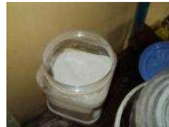
Quarzsand 0,1 mm