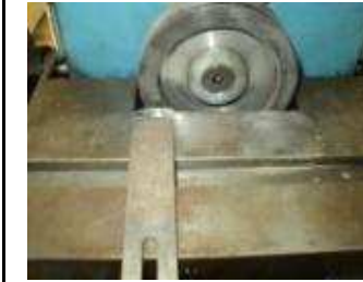
Diamant Schabmesserschleifmaschine 5 Grad Freiwinkel