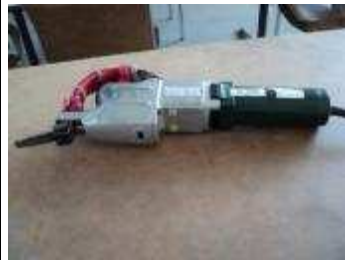
Schabmaschine 10 Punkte pro /Zoll