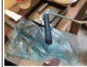
Touchier Rolle immer in einem sauberen Plastik Sack vor dem Schmutz schützen