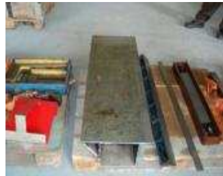
Grosser Lineal 400 mm breit. Für 20 Meter Maschinenbetten