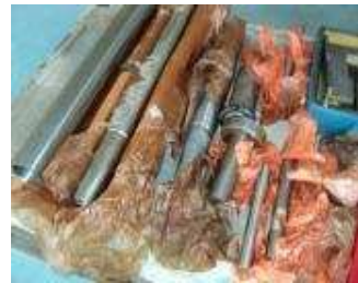
Div. geschliffene Wellen, teilweise mit Konen