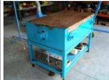
Touchierplatte 800 x 1200 mm