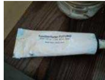
Touchierfarbe der Firma Brütsch Rüeegg