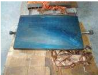
Touchierplatte 400 x 600 mm