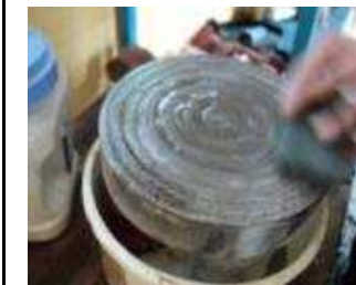
Dann mit dem Stein grosse Kreisbewegungen machen