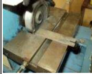
Kühlen mit Petrol. Nur 5 Gramm Anpressdruck