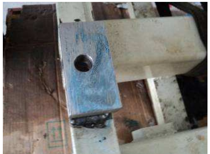
Photo 11. Was täten wir auch ohne Touchierfarbe von Brütsch Ruegger?