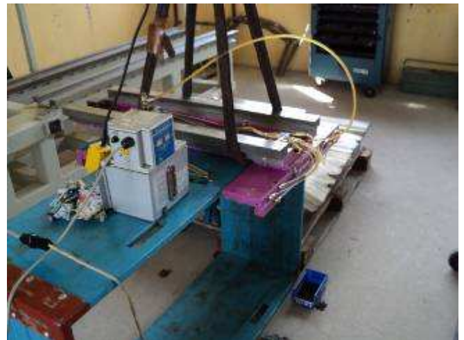
Photo 22: Endlich sind wir soweit, dass alle Schmierleitungen gereinigt wurden und keine Späne mehr drin sind. Jetzt kommt der Testlauf der Schmierung. Wir lassen alles ca. 8 Stunden laufen und reinigen nochmals alles, bevor wir den Schlitten fest aufsetzen, dann wird er nicht mehr demontiert.