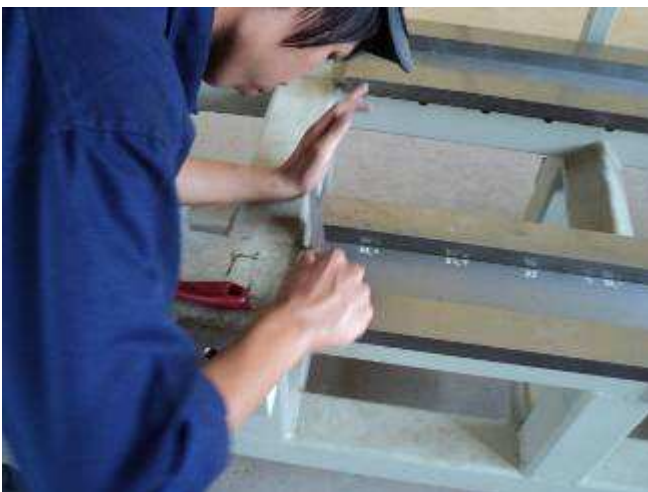
Photo 19: Damit die scharfkantigen Führungen nicht die Abstreifen beschädigen, wenn man über diese hinaus fährt, muss man die Kanten gut brechen.