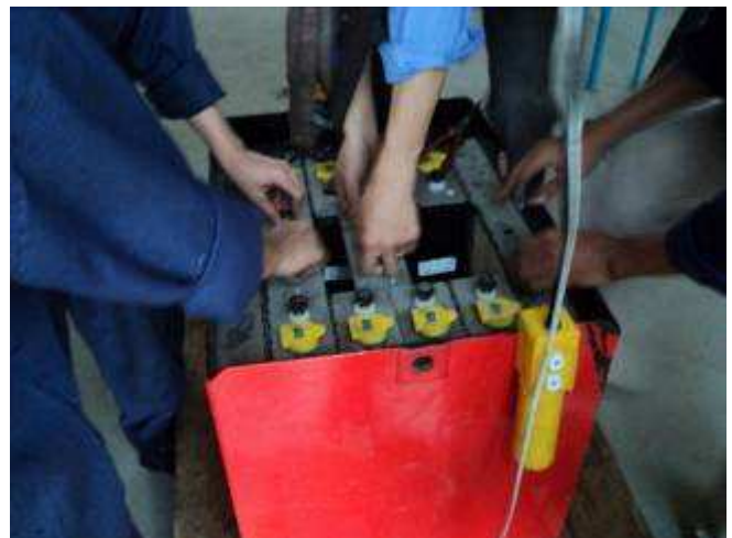
Photo 27: An unserem Steinbock Stapler aus der Schweiz, 1000 Kg Hublast, ist die Batterie defekt.