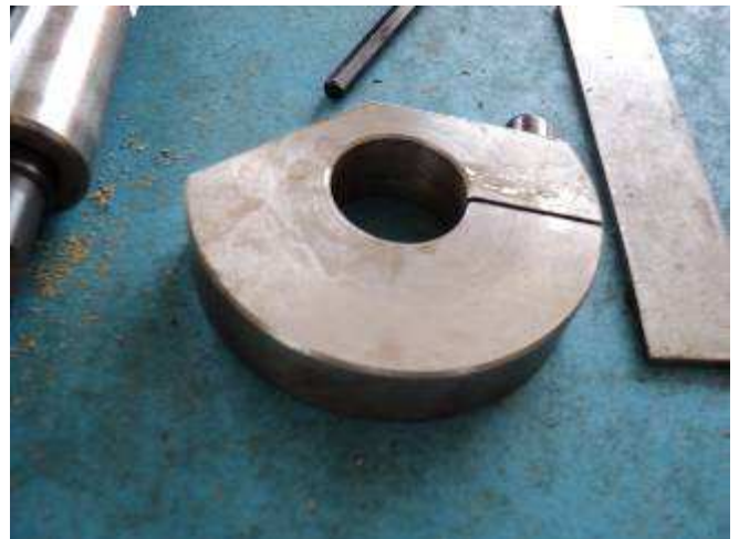
Photo 17: Dies ist der Excenter für unsere neue, kleine Metalltensionsanlage LC 05. Wir machen hier in Vietnam das erste Modell. Es ist interessant, wenn die Lehrlinge Arbeiten machen können, die sie/wir auch brauchen können.