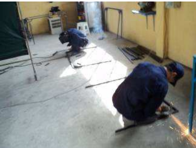
Photo 13: Doch die Lehrlinge dürfen nun auch schon alleine Tische schweißen.