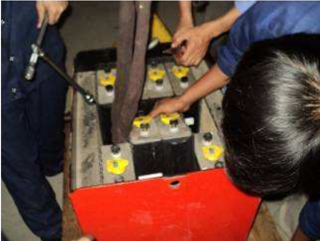
Photo 28: Nach Rückfrage bei Steinbock (dem Staplerhersteller) ob diese repariert werden kann, kam ein „nein“. Notfalls könne man eine LKW Batterie nehmen. Die hätte uns 400 Franken gekostet 200 Amp. 2 x 12 Volt / 24 Volt. Doch unser Koordinator Hieu sagte, viel billiger ist reparieren, darum bauen wir sie aus.