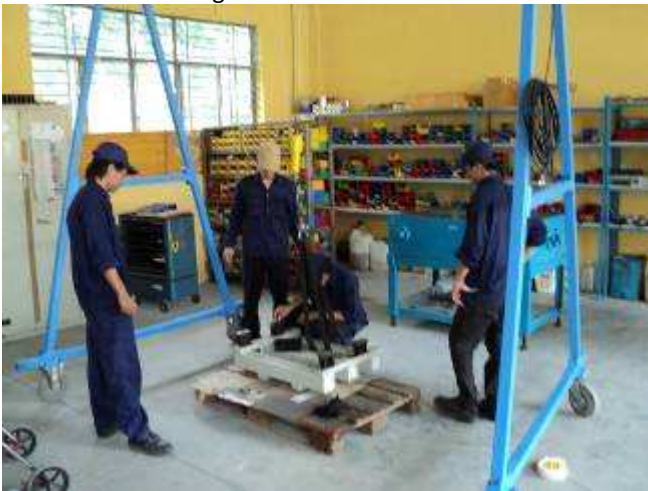
Photo 7: Am 09.06 2011 geht es weiter mit Schaben an der Drehmaschine. Wir sind froh um die Kranlösung.