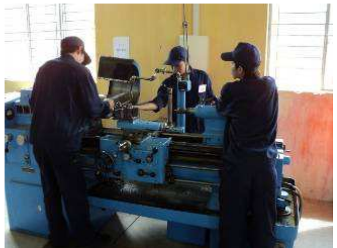
Photo 16: Wir haben zur Zeit nur einen Drehbank (eine Menziken aus dem Aargau) Aber wir werden 3 ausleihen können, bis wir den nächsten Container nach Vietnam senden.