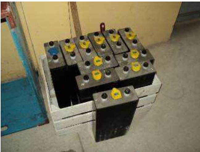
Photo 29: Hier sind die Batterien bereit, um in die Reparatur gebracht zu werden. Für die Fracht müssen wir 5 Franken zahlen, es kommt einer mit einem Lasten-Mofa. Jede Batterie ist 18 kg, das spezifische Gewicht ist somit bei dieser Batterie 3,3 kg. Es sind 12 Stück.