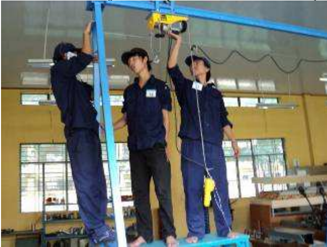
Photo 6: Hier montiert man auf der Höhe von 3.5 Meter die Laufkatze mit 250 kg Hebekraft