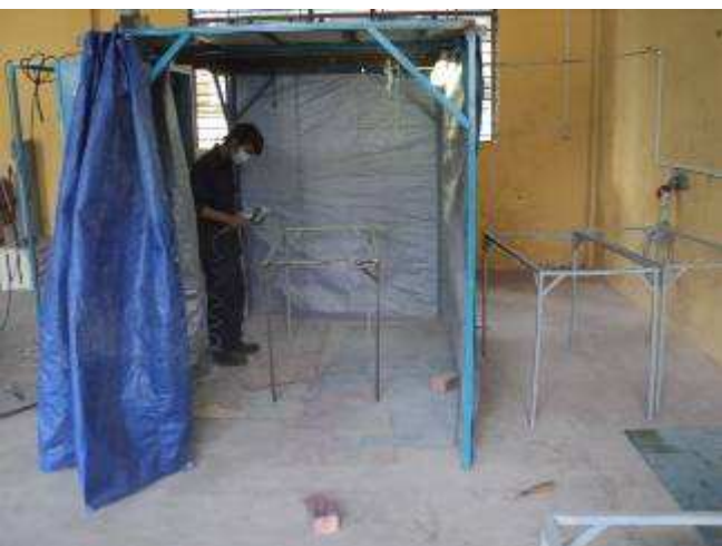
Photo 14: Wir haben nur eine einfache, selbstgebaute Spritzkabine. Die Absaugwand kauften wir in der Schweiz, aber es hilft schon recht, dass man gut spritzen kann.