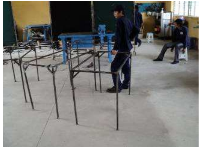
Photo 4: Aber das mit den Palettenrahmen wollen wir ändern. Mit 16 Tischen haben wir begonnen; den Stahl haben wir gekauft für 160 Franken ( 3.6 Mio Dong)