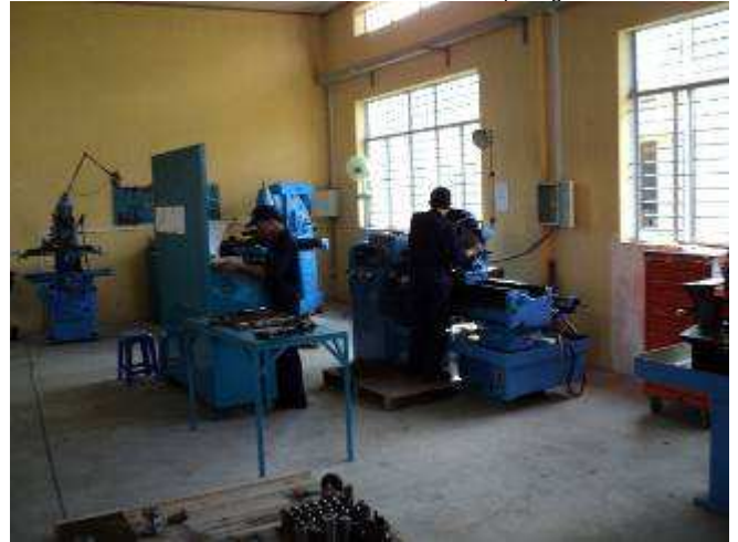
Photo 15: In der mechanischen Abteilung dürfen jetzt die Lehrlinge auch schon selber drehen. 10 Set Stiftenzieher ist ein interner Auftrag.