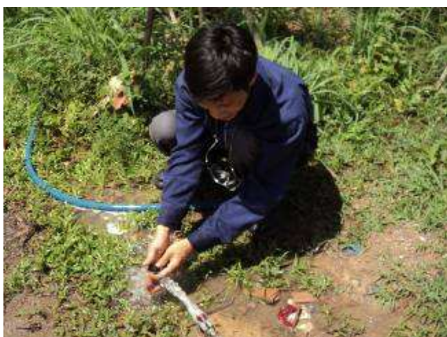
Photo 33: Obwohl man ja eine Toilette mit genügend Wasser hat, wäscht man die Hände lieber im Freien. Sogar unser Geschirr (Kaffeetassen und Gläser) waschen die Lehrlinge hier ab.