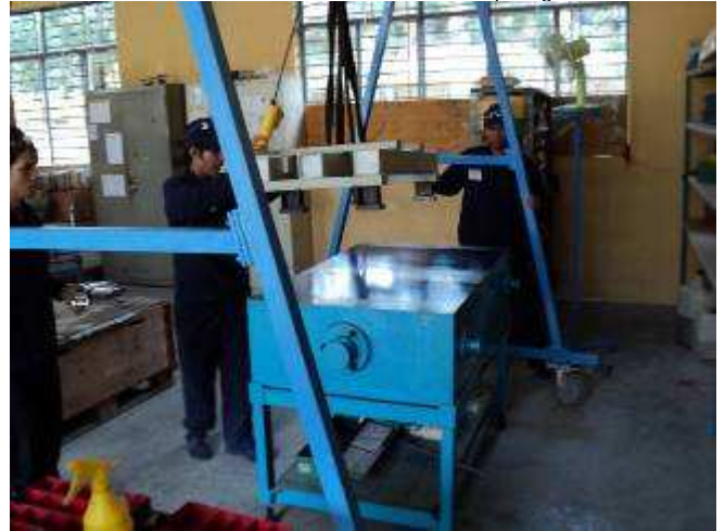
Photo 9: Mit grösstem Interesse führen die Lehrlinge ihre Arbeit aus. Viele muss man wegrufen von der Arbeit für die 15 Min. Pause, weil sie so vertieft sind in ihr Tun.