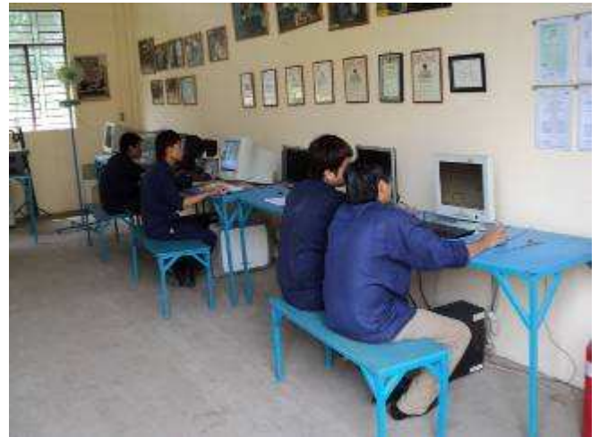
Photo 31: Die Zeichnungsabteilung hier wird immer aktiver. Nach einem genauen Präsenzkontroll System, kommen immer wieder alle Lehrlinge in den Raum und können zeichnen. Sie werden sehr gut, weil sie daneben eben auch immer die Praxis sehen und ausführen können. Ab Sommer 2011 wollen wir noch 6 Zeichnungsplätze mehr.