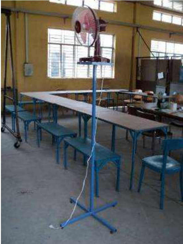
Photo 23. Wir haben 8 solche Ventilator Ständer hergestellt. Die Lehrlinge mussten, als die Ständer fertig waren, in 3 Ansichten alles von Hand zeichnen. Das ging recht gut. Die in der Vietnam Schule gelernte Theorie helfen mit, dass die Jungen schneller lernen. Hier kostet ein Ventilator 10 Franken. Einer mit Ständer kostet 50 Franken und ist zu wenig hoch. Also ist es oft billiger, wenn man sowieso Arbeiten haben will, etwas selber zu machen. Hinten sieht man auch die neuen fertigen Schultische machten wir alles selber hier in der Lehrwerkstatt, incl. den Tischplatten aussägen