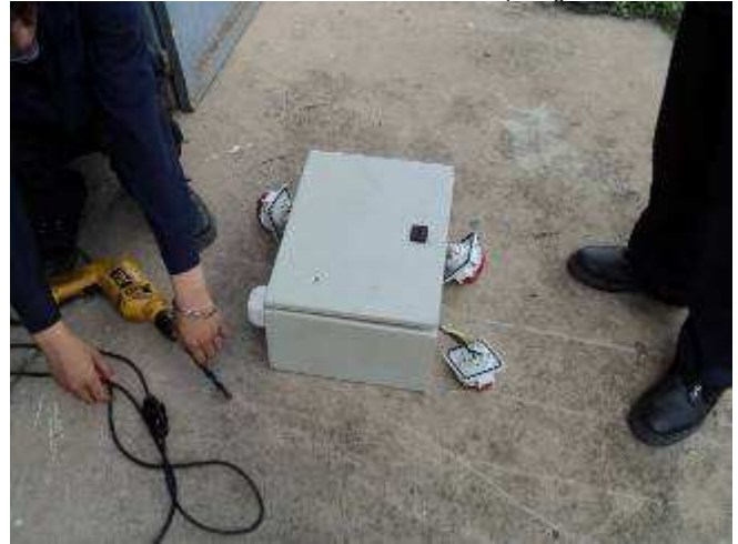
Photo 25: Eine der grössten Aufgabe, die wir noch zu tun haben mit den Jungen hier, ist, dass sie immer alles auf dem Boden machen. Wir wissen nicht, wie viele Jahre es dauert, bis wir ihnen beigebracht haben, dass wir gerne auf einem Tisch / Werkbank arbeiten möchten.