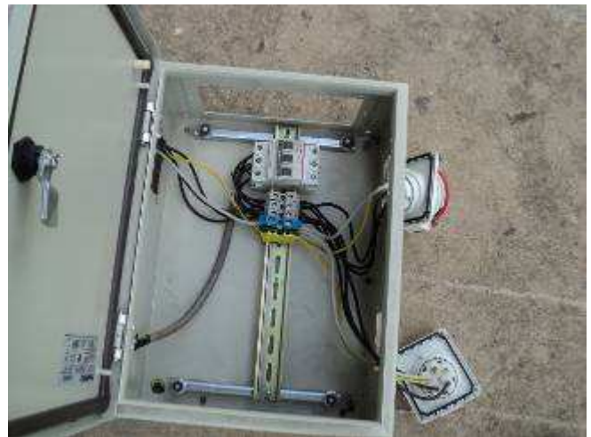
Photo 26 Mit 3 Stecker 400 Volt 16 Amp, 1 x 400 Volt 10 Amp. (Schweizer Stecker) und 220 Volt (Schweizer Stecker). Verdrahtet wird der Schrank noch einmal schön. Photo 26: Das gibt eine Elektrobox für die Elektrowerkstatt