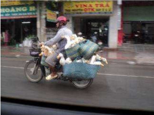
Photo 01: Auf dem Weg zur Schule, ca. 45 Min. ein Weg, sieht man jeden Tag, Tiertransporte aller Art.....

Projekt Wiap-KFKOK Vietnam, "education for every one" 09.06.2011 Secondary school of south east area mechanics and electricity at Thien Tan Commune, Vinh Cuu District, Dong Nai Province; Vietnam Erstellt: 09.06.2011 Photos vom Juni 2011