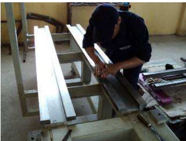
Photo 20: Mit grossem Respekt gehen die Jungen an diese Arbeit. Wir denken, dass wir einen Teil der Leute als Assistenz-Lehrer behalten sollten.