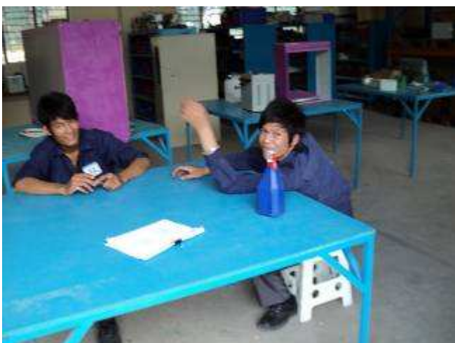
Photo 24: Ouu! da haben wir gerade ein Student beim Schlafen am Tisch erwischt. „Schelmisch“ lachen können sie ja schon! Als wäre nichts gewesen.