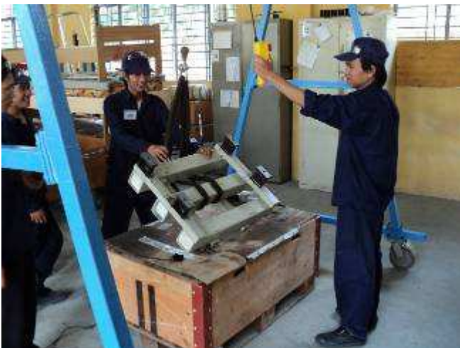
Photo 8: Wir beginnen um 07.00h bis 11.00h und 13.00h bis 17.00h. Neu haben die Lehrlinge von 09.00h bis 09.15h und von 15.00h bis 15.15h, eine Pause, damit sie sich nicht immer verschlafen.