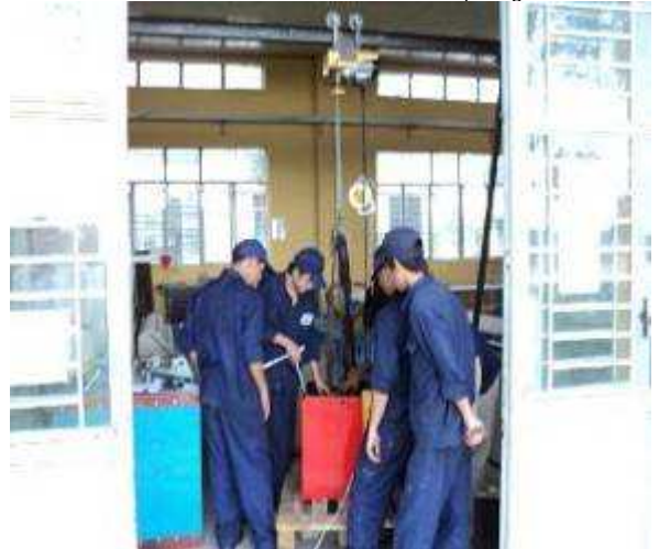
Photo 30: Hier haben wir noch eine schöne Aufgabe für den Montag. Alle Lehrlinge müssen das Gewicht ausrechnen des Batteriebehälters und es hat da noch 6 schwere Blei Platten drin. Hinten sieht man den Kran; das Elektrische ist im Moment noch provisorisch und gemalt ist er auch noch nicht. Aber das sind Arbeiten, welche die Lehrer und Studenten machen sollen, wenn wir nicht hier sind. Für uns hat im Moment die Montage der Schuldrehmaschine, Priorität Nr. 1.