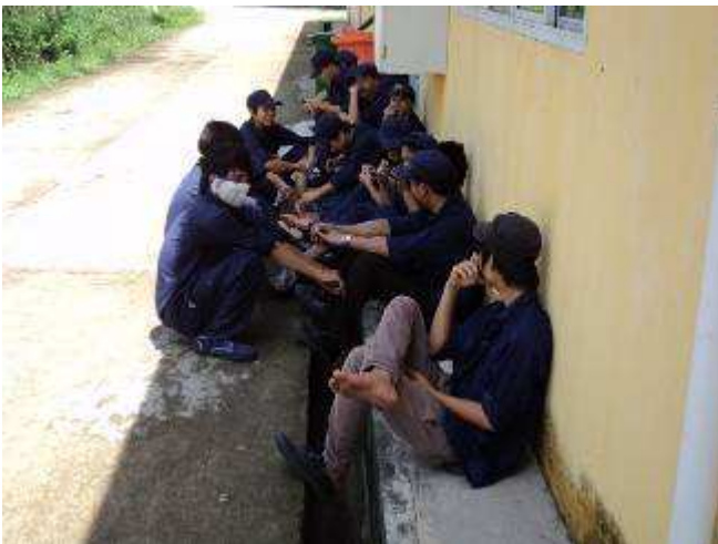
Photo 02: 10 Minuten vor Feierabend um 17.00h, sitzen die Lehrlinge draussen, während 3 weitere Lehrlinge alle 6 Hallen / 12 Tore abschliessen auf unseren 1000 m 2 Ausbildungsfläche.