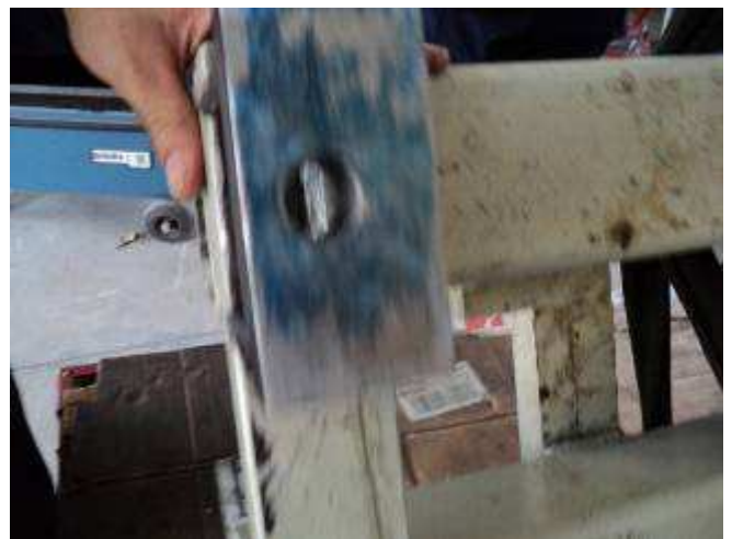
Photo 10: Ja, da hat es zuviel Petrol im Touch, aber es kommt gut.