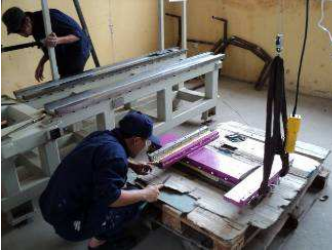
Photo 18: Hier reinigt man den Z Schlitten der Schuldrehmaschine DM02_S und prüft die Schmierung, zieht dann die Führungen ab zum fertig montieren.