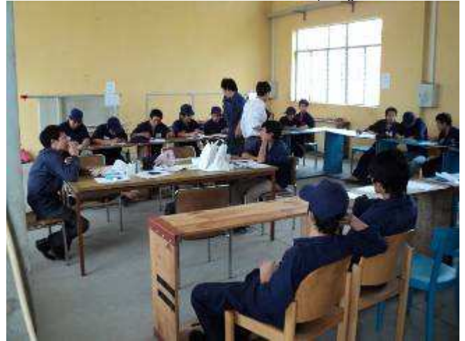
Photo 3: Hier haben wir den Schulungsraum resp. Meetingraum noch mit Palettenrahmen ergänzt.