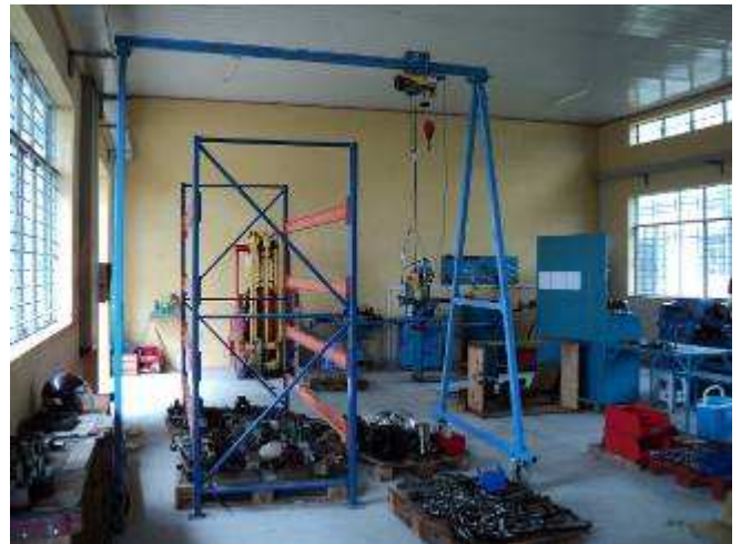
Photo 27: Da unsere Batterien defekt sind an unserem Gabelstapler, müssen wir neue kaufen. Behelfsmässig konnten wir mit dem Eigenprodukt Kran dieses Gestell gut abräumen. Wir verschieben es, es kommen mehr Maschinen in diese Halle.