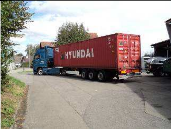
Photo 25: Das ist der Container , 12 Meter lang, der ab Safenwil nach Vietnam kommt. 180000 Gesichtsmasken sind mit dabei, die wir als Sachspende bekamen.