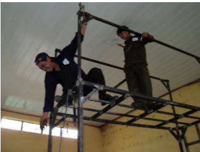
Photo 15: Fast 2 Wochen hat man doch benötigt für das Gerüst. Wir sind eben eine Lehrwerkstatt. Zeit ist noch nicht der Schlüssel, sondern das Können.