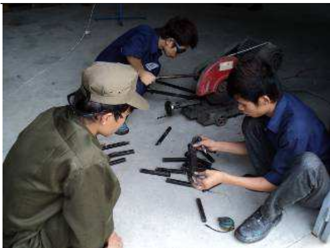
Photo : Die 24 neuen Lehrlinge brauchen wieder mehr Sitz Bänkli. Hier wird das Material zugeschnitten. Obwohl wir eine Säge haben, sie trennen lieber mit der Trennscheibe und wählen die Arbeit am Boden.