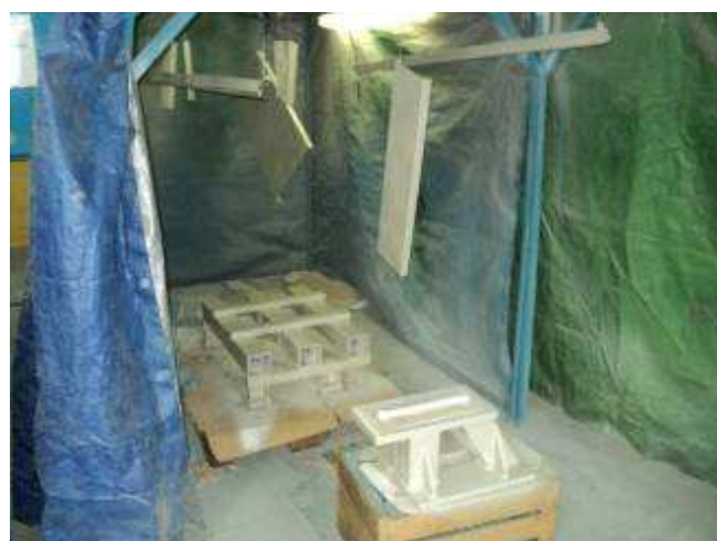
Photo 4: Damit die Jungen auch malen lernen, ist diese Behelfskabine gut.