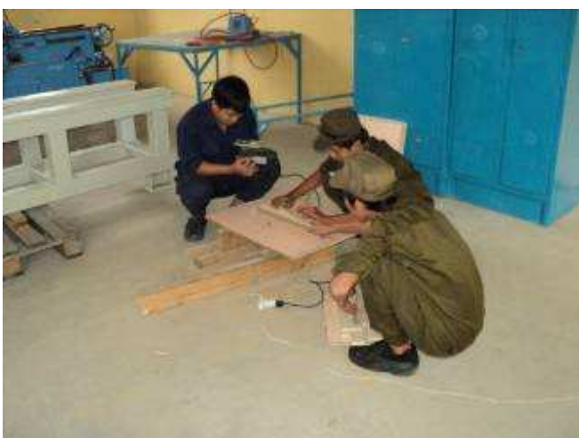
Photo 31: In unserem Büro haben die Mäuse und Ratten am letzten Wochenende unsere Suppen weggefressen. Jetzt ändert eine Gruppe Lehrlinge diese Metallschränke, dass wir alles wegsperren können, dort können sie nicht rein.