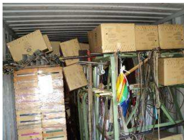
Photo 23: Wieder ein Container, unser Nr. 8, ist unterwegs nach Vietnam. Am 25 .10 soll er ankommen. Auch ein 2 Tonnen Kran ist dabei. Fräsmaschine, Bohrmaschine, Transportmaterial u.s.w