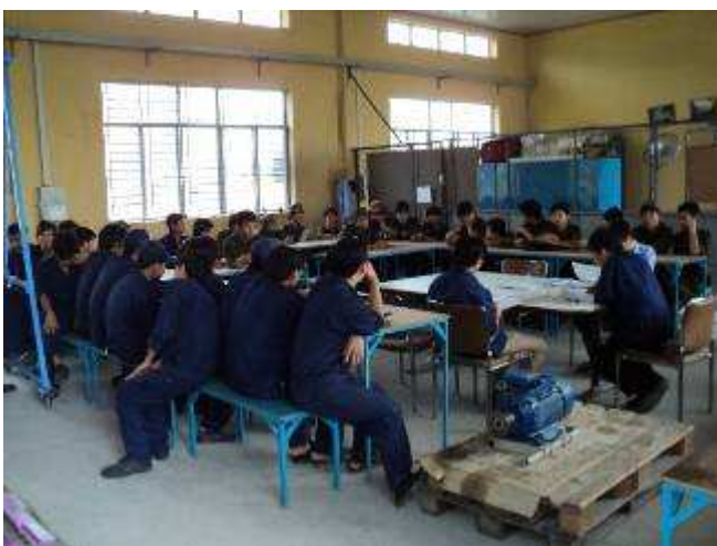
Photo 1: Ein neues Gefühl, 45 Lehrlinge mit nur 3 Lehrer. Die zweite Woche ist viel besser gelaufen, als wir vermutet haben. Der Name steht bald fest. Unsere Lehrlinge werden „Polypratiker“