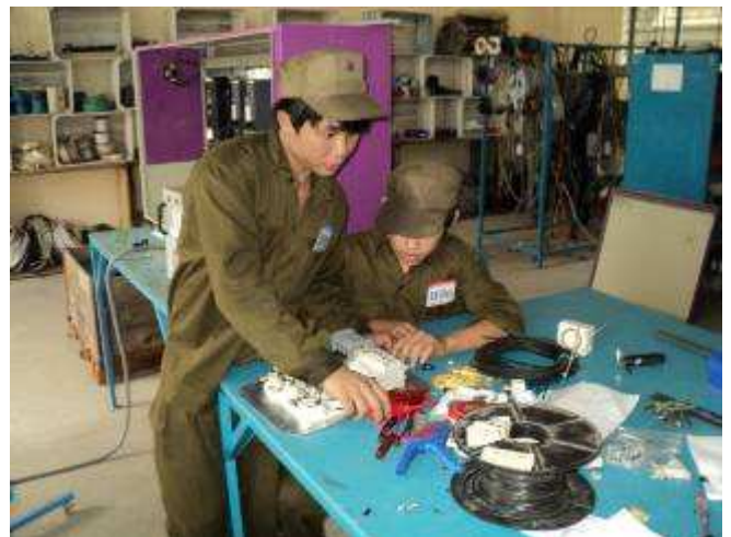
Photo 28: Hier machen auch schon die neuen Lehrlinge mit den 2. Lehrjahr Lehrlingen, einen Elektroschrank, um die neuen Maschinen anschliessen zu können.