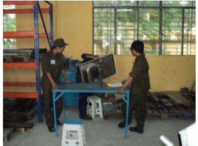
Photo 17. Hier müssen 3 Lehrlinge für ein Abwaschbecken einen Rahmen zeichnen und dann gleich von A bis Z fertig machen, damit die Lehrlinge nicht immer am Boden im Freien abwaschen müssen.