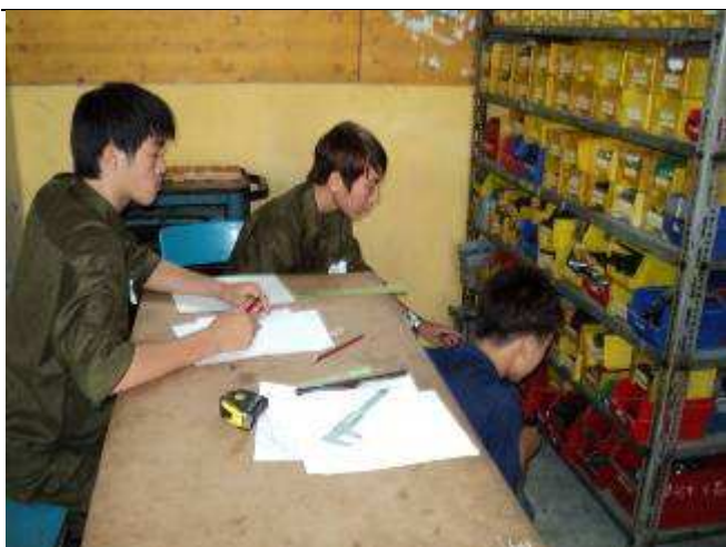
Photo 19: Wir wollen eines der besten Schraubenlager. Es muss alles einwandfrei eingeordnete sein. Alle Schrauben müssen erfasst sein. Die neuen Lehrlinge können gleich lernen da reinzuwachsen.