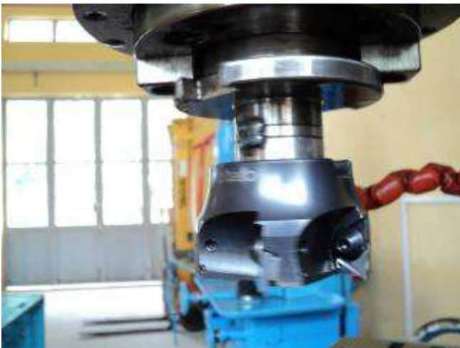
Photo 26. Warum haben die Lehrer hier am Fräswerkzeug die Distanzringe angeschweisst? Wenn man richtig hinsieht, sieht man, dass sie den Konus nicht richtig montierten. Bis heute wissen wir nicht, wer das war!