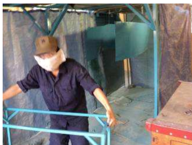
Photo3: Und schon ist es soweit