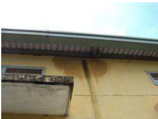
Photo 30. Solche Wasser Löcher werde auch repariert