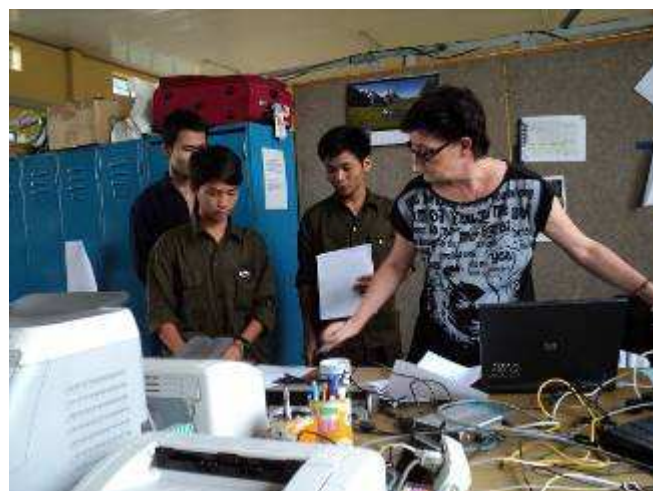
Photo 32. Jeder Lehrling hat eine Nummerkarte. Die im 2. Lehrjahr 1 bis 25. Die Erstlehrjahr B1 bis B25. Die Karten werden am Abend immer abgegeben und am Morgen geholt. Wenn einer fehlt wird die Karte im Sekretariat deponiert und am andern Tag muss der Lehrling die Karte holen. Damit er sie bekommt, muss ein Zettel ausgefüllt werden, mit dem Grund, warum er nicht anwesend war.