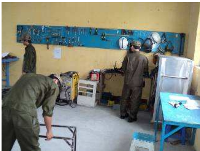
Photo 6: Und die grünen Lehrlinge, erstes Lehrjahr, können gleich für sich selber Bänke machen.