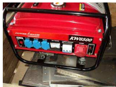
Photo 24: Neuer Generator im Container 8. Der Generator, den wir früher schon sandten, ist weggekommen, auch die Magnetbohrmaschine, Autogenanlagen, Beamer. Jetzt haben wir es neu kaufen müssen, doch jetzt passen wir auf.