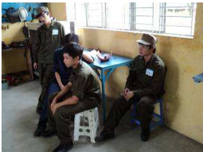
Photo 7; Wenn eben 45 Junge in 8 Räumen aufgeteilt sind, ab und zu sitzen auch welche herum.