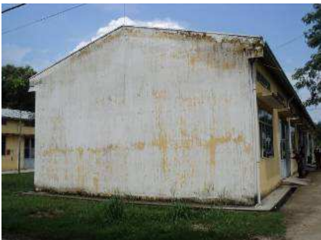
Photo 29.:Diese Hallenwand wurde auf den letzten Tag der offenen Tür neu gemalt. Also Jan. 2011. Das ist Qualität in Vietnam. Einfach nicht akzeptabel. Darum werden wir alle Hallen neu malen, aber wie in der Schweiz. D.h. unsere Lehrlinge werden das machen und keine lokalen Maler.