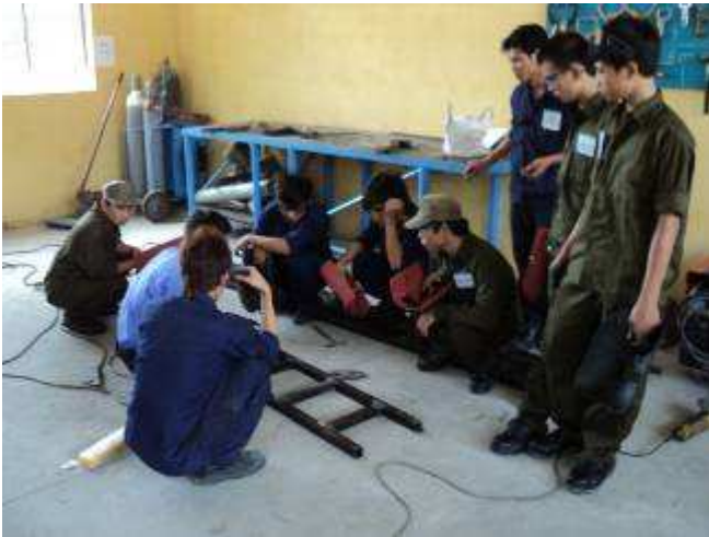
Photo 14. Hier beginnt man mit der Leiter.