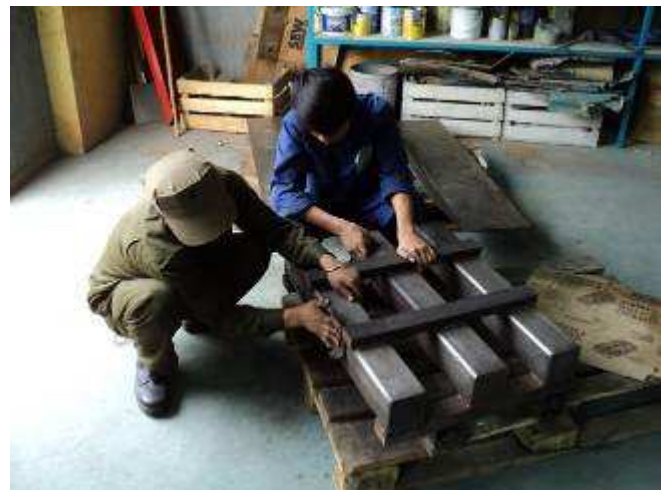
Photo 18: Hier eine Spindelstockkonsole für die Drehmaschine Wiap DM2S Nr. 2. Vorbereitung zum spritzen