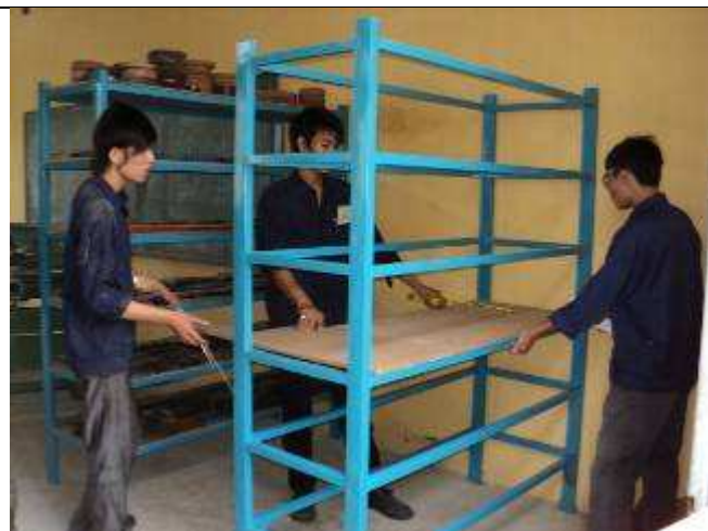
Photo 8: Das 2 Stahlhalter Gestell ist fertig - hier noch die Bretter zurschneiden