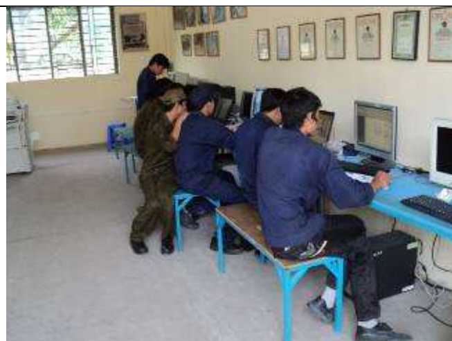
Photo 22. Wir sind sehr froh, dass im neuen Container mehr Computer nach Vietnam kommen.