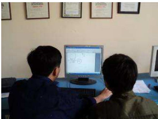
Photo 20: In Angola hat man so gebeten um Rollstühle. Immer wieder reissen dort die Minen den Menschen die Beine weg. D.h. es gibt viele Invalide. Wir haben uns vorgenommen, einen Prototyp Rollstuhl herzustellen, den man selber in jedem Land dann zB in Schulen machen kann. Hier zeichnen wir daran.