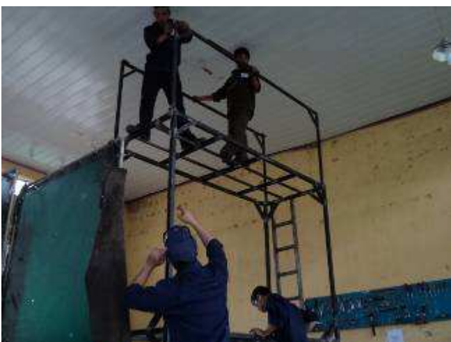
Photo 16: Wenn das obere Geländer weg ist, es ist schraubbar, kann man von Halle zu Halle fahren. Auch wenn wir einmal etwas hohes montieren, macht das Gerüst Sinn. Ev. machen wir noch ein tieferes für die Maschinenmontagen.