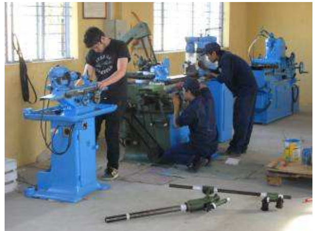
P18. Dies ist noch eine kleine Rundschleifmaschine. Wir haben sie noch zerlegt alles gereinigt, die ist sehr einfach aber gut zum lernen.