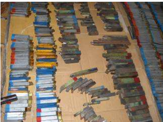
P22: Im Lager bei Hieu hatten wir noch einige Palette Drehstähle diese haben wir jetzt noch geholt und hergerichtet.