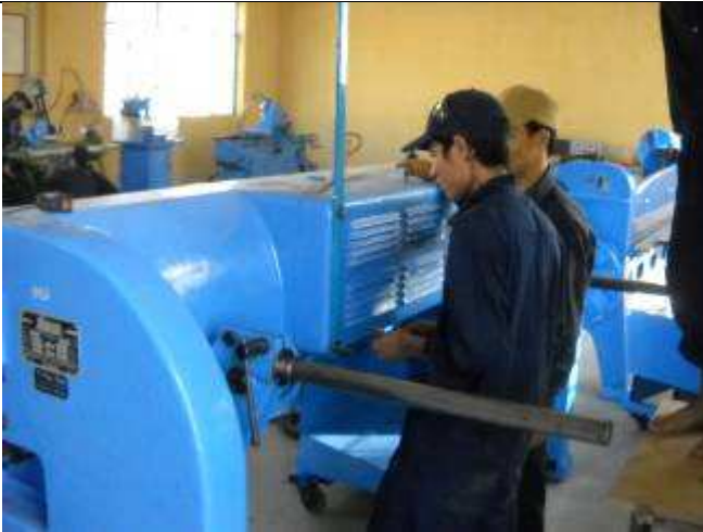
P15. Für diese Schweizer Schere Hänggi, benötigen wir den Strom von oben, weil wir unten mit Blechwagen rumfahren müssen. Die erste Version der Befestigung war an der Türe wo man immer öffnen muss.