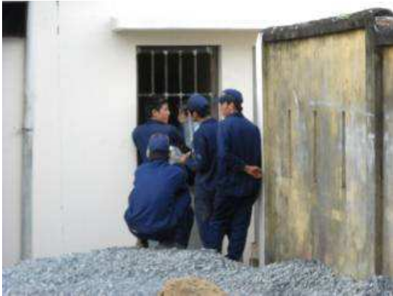
P10: Unser WC benötigt noch ein Tor es gehen immer Fremde auf unsere Toilette und erhöhen unsere Reinigungsarbeiten.