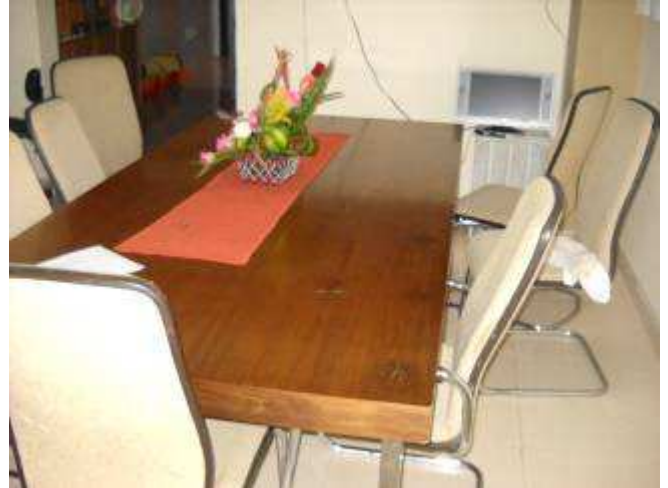
P23: Unser Tisch und die Stühle die wir im Jahr 1981 kauften, d.h. 30 Jahre alt!