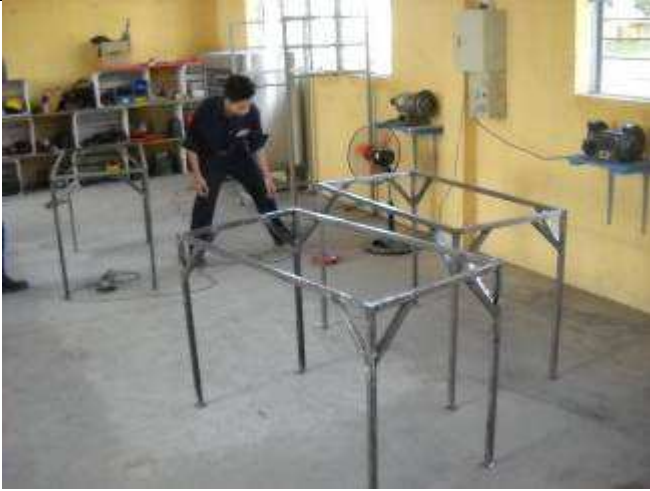
P20: Sehr viele Tische und Gestelle die wir in den letzten Wochen machten, sind jetzt verteilt in den div. Räumen.