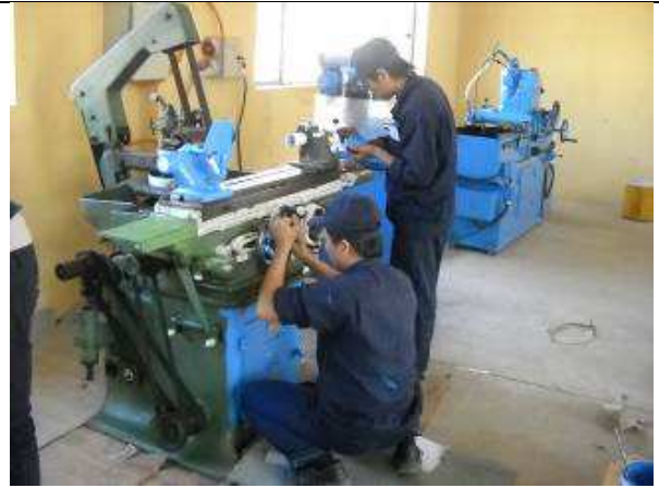
P17. Hier die Uralte Rundschleifmaschine der Fa. Studer Thun, Schweiz die wir von Sulzer abkauften und die lief bis zum letzten Tage dort in der Produktion. Wir bauen sie jetzt noch um, für Drehmaschinen Spindeln. Sie ist ca. 80 mm zu niedrig in der Spitzenhöhe