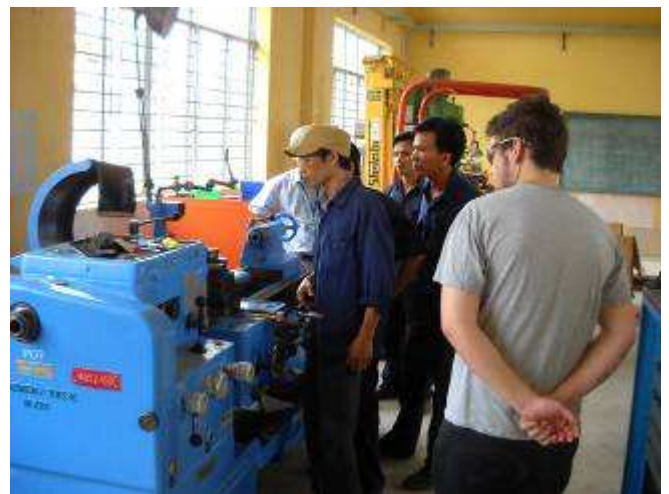
P13. Jetzt haben wir bei wenigen Maschinen die Lehrer autorisiert um zu schulen. Sie mussten zuerst selber mal drehen, Dann beginnt die Papierarbeit. Ohne Authorisierung dürfen sie die Maschinen nicht benutzen.