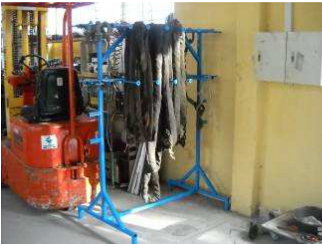
P9: Unser neues Seilgestell, hergestellt bei uns.