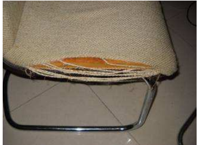
P24. So sahen die Stühle bis vor 2 Tagen aus, eben nach 30 Jahren.