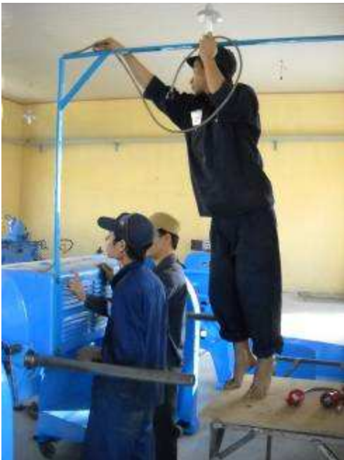
P16. Was in der Kinderstube der Jungen vorgeht, erkennt man, wenn sie immer die Schuhe ausziehen wenn man auf etwas klettert, Dass dann die Füße unten Brandschwarz sind und man damit wieder in die Schuhe steigt stört sie nicht.