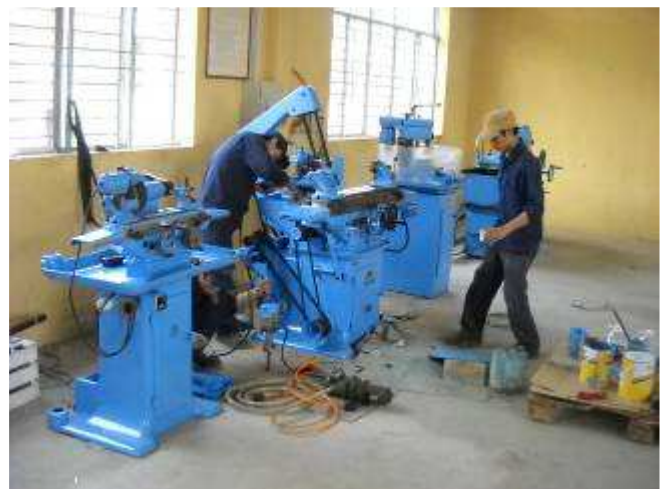
P19. So jetzt ist die Studer Thun Maschine auch fertig gemalt.