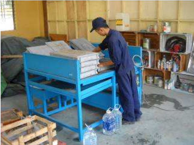
P21. Auch unser Waschplatz der ohne Lösungsmittel funktioniert, hat schon viele Stunden genutzt werden können.(Eigenkonstruktion von uns 3 Schmutzkammern)