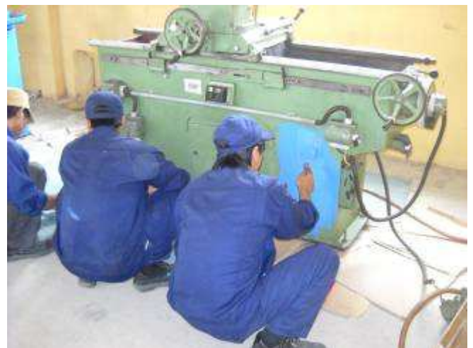
P14: Alle Maschinen werden gemalt auch unsere Göckel Topfschleifmaschinen.